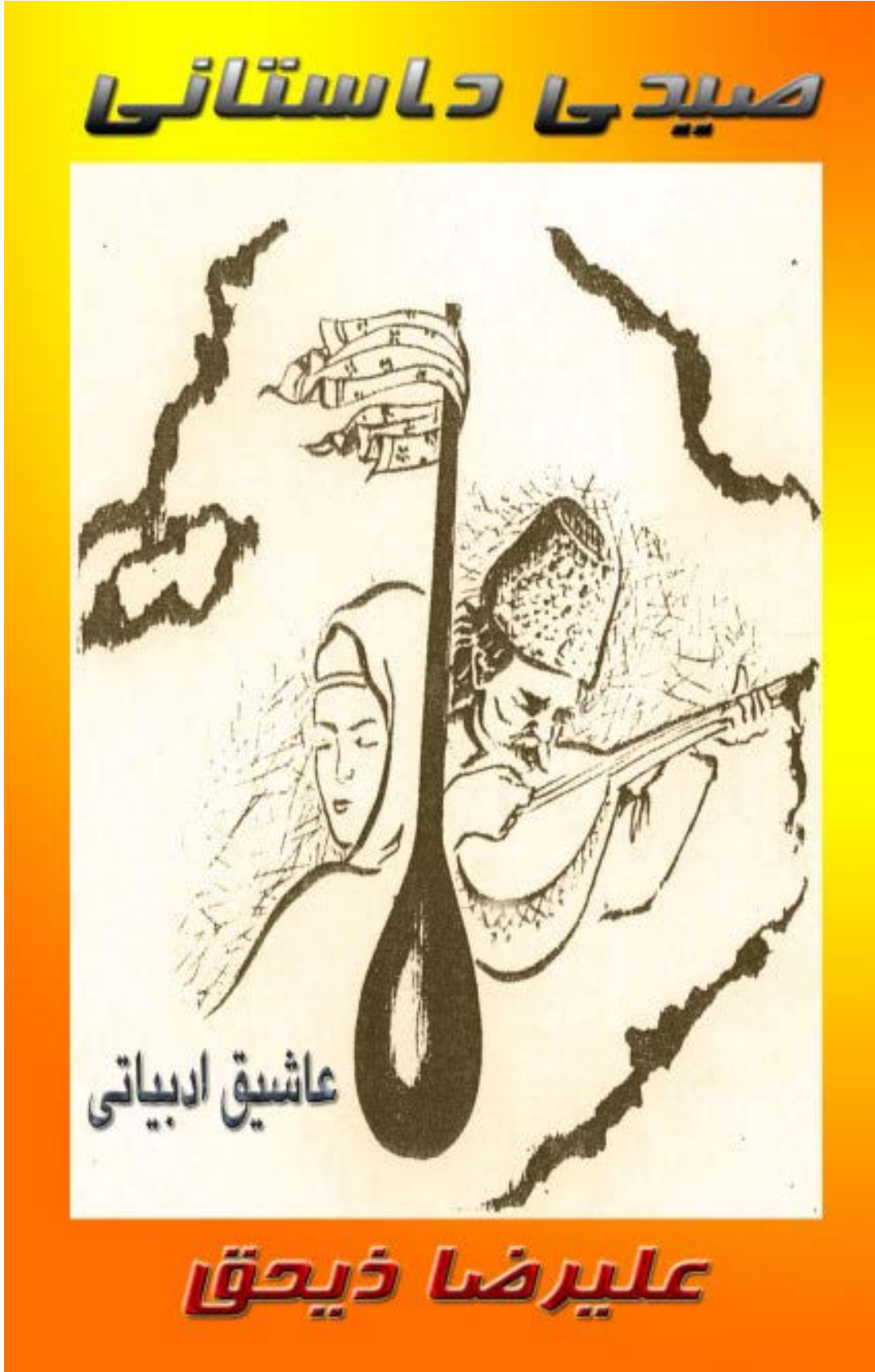
Ek: 5 Seyidi Hikâyesinin Kapak Fotoğrafı