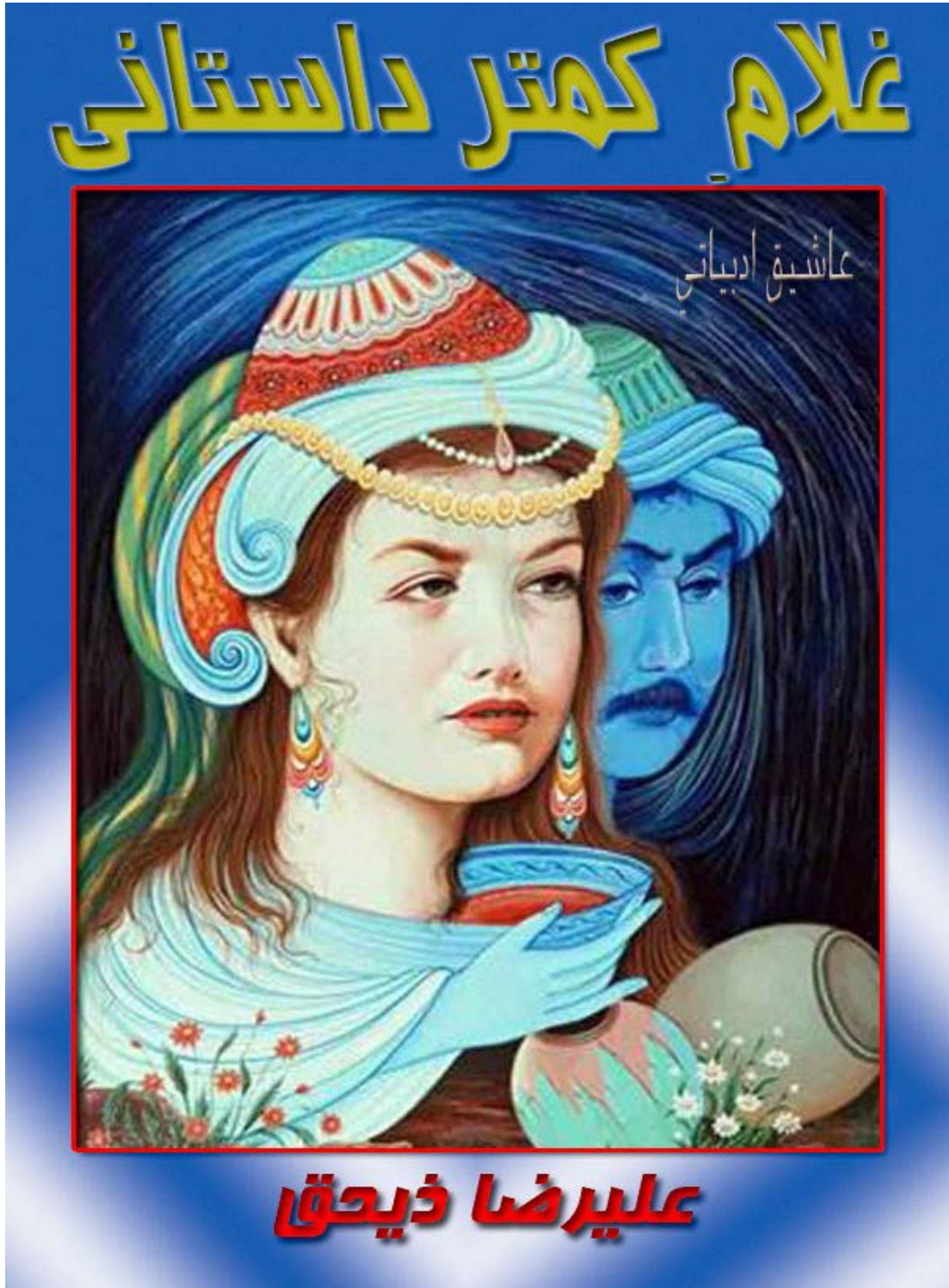
Ek: 3. Gulami Kemter Destanı Kapak Fotoğrafi