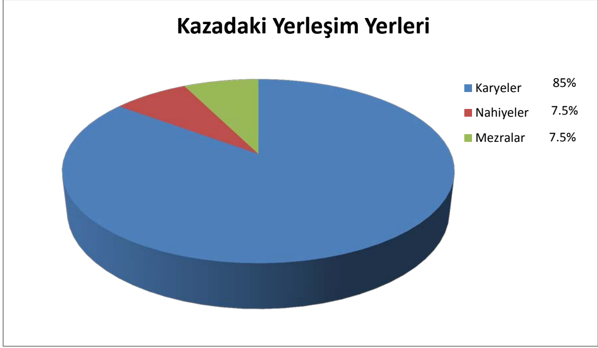
Şekil 1. 89.Numaralı SŞS Kayıtlarında Tespit Edilen Yerleşim Yerlerinin Oranları