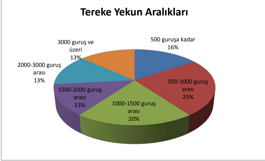
Şekil 2. 89 Numaralı SŞS Kayıtlarında Tespit Edilen Terke Yekünlerinin Oransal Dağılımı