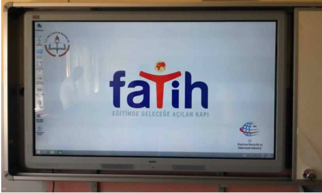
Şekil 2.1. Akıllı Tahta

tahta” olarak bilinen bir eğitim aracıdır (Sancak 2017: 14,15). Akıllı tahtanın maliyetinin eğitim sektörü için daha uygun olmasıyla akıllı tahta kullanımı ülkemizde yaygınlaştırılmıştır. Ülkemizin doğusundan batısına kadar herkese eşit bir imkân sağlamak amacı ile kullanılmaktadır.