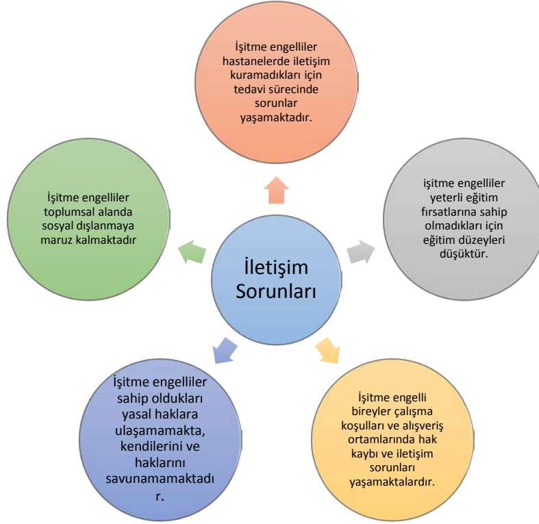
Şekil 4. İşitme engellilerin iletişim sorununa bağlı olarak çeşitli alanlarda yaşadıkları sorunlar.

Şekil 4.'te gösterilen iletişim kaynaklı sorunların çözümünde yine işitme engelli bireylerin yaşantılarından ve beklentilerinden yola çıkılarak Türkiye'deki işitme engellilerin kamusal alanlarda yaşadıkları işaret dili eksikliğine bağlı sorunlar olduğu tespit edilmiştir. Bunun çözümü için üretilecek öneriler de işaret dili eksenli olacaktır. İşaret dili ve işitme engellilerle ilgili olan bu araştırmada işitme engellilerin yaşanan sosyal uyum sorunlarına bir çözüm kapısı açılacağı beklenmektedir.