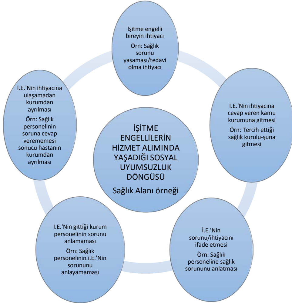
Şekil 3. İşitme engellilerin hizmet alımında yaşadıkları sosyal uyumsuzluk döngüsü.

iletişim yöntemleri olan işaret dilini kullanmaktadır. İşitme engellilerin kullandıkları işaretleri anlamayan kamu personelleri hizmet alan-veren ilişkisinde bir kopukluğa neden olmakta ve çözüm üretememektedir. Bu döngü Şekil 3.'te yer almaktadır.