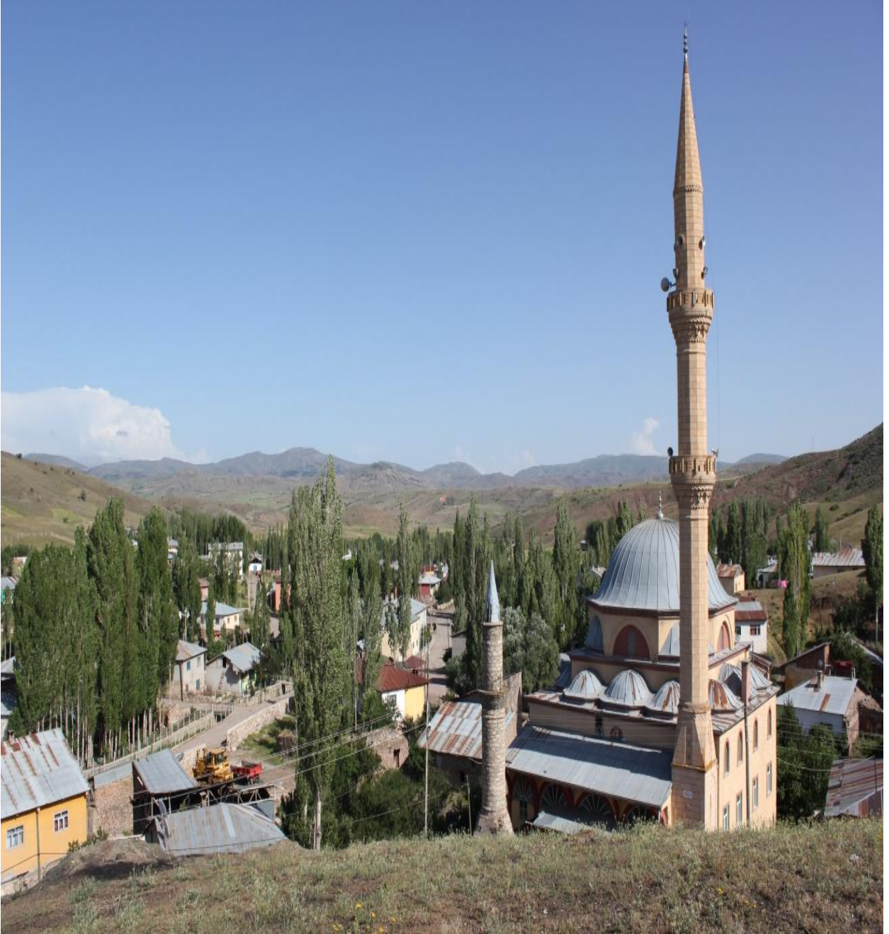
Resim 10: Beldenin Camisi