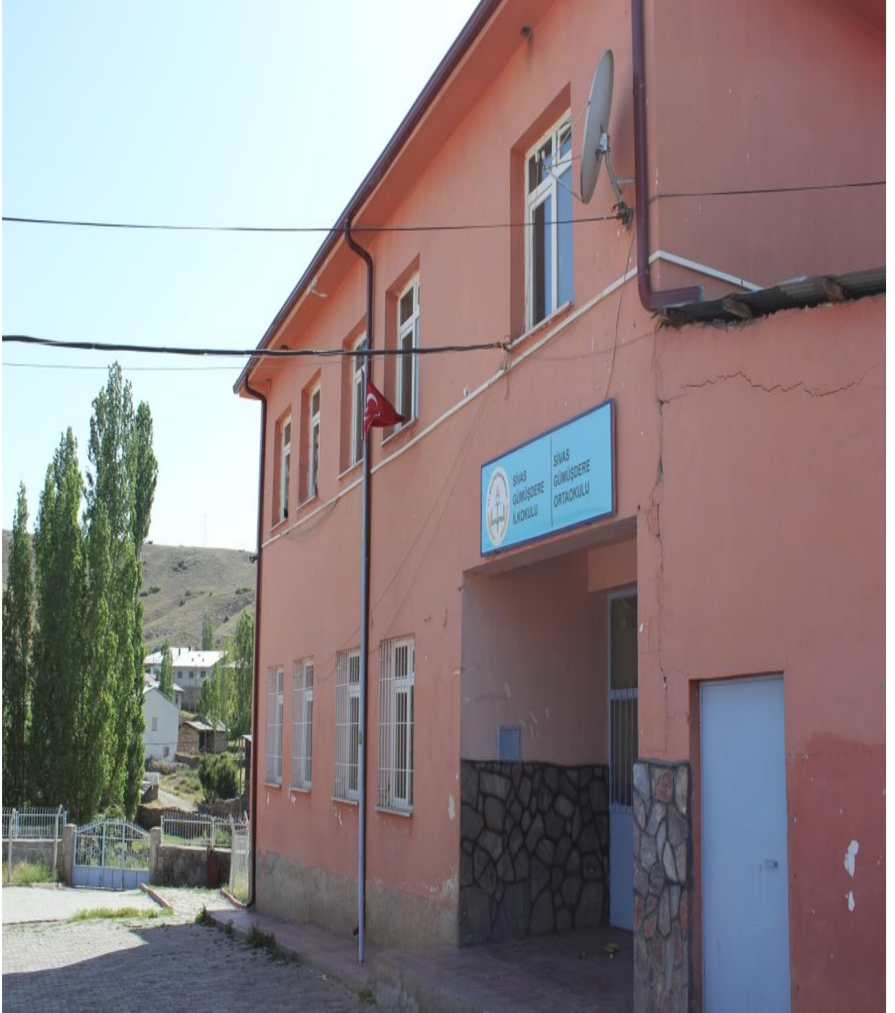
Resim 14: Beldenin İlköğretim Okulu