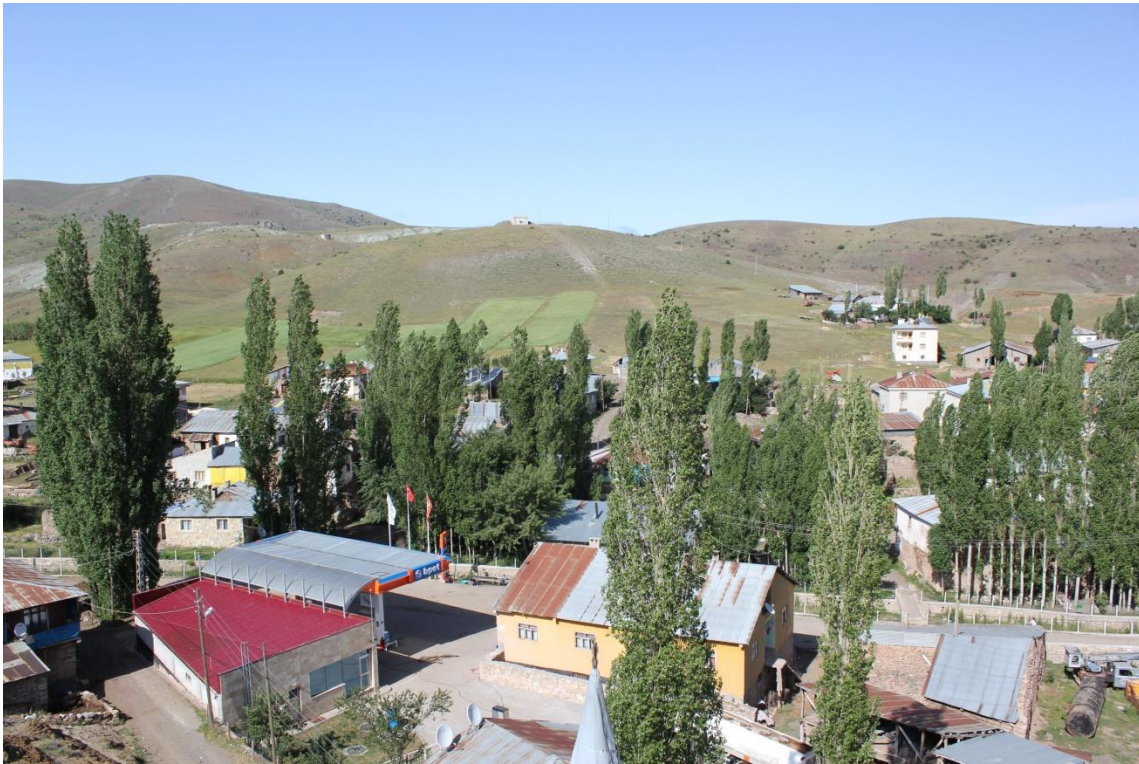
Resim 16: Beldenin Genel Görünümü