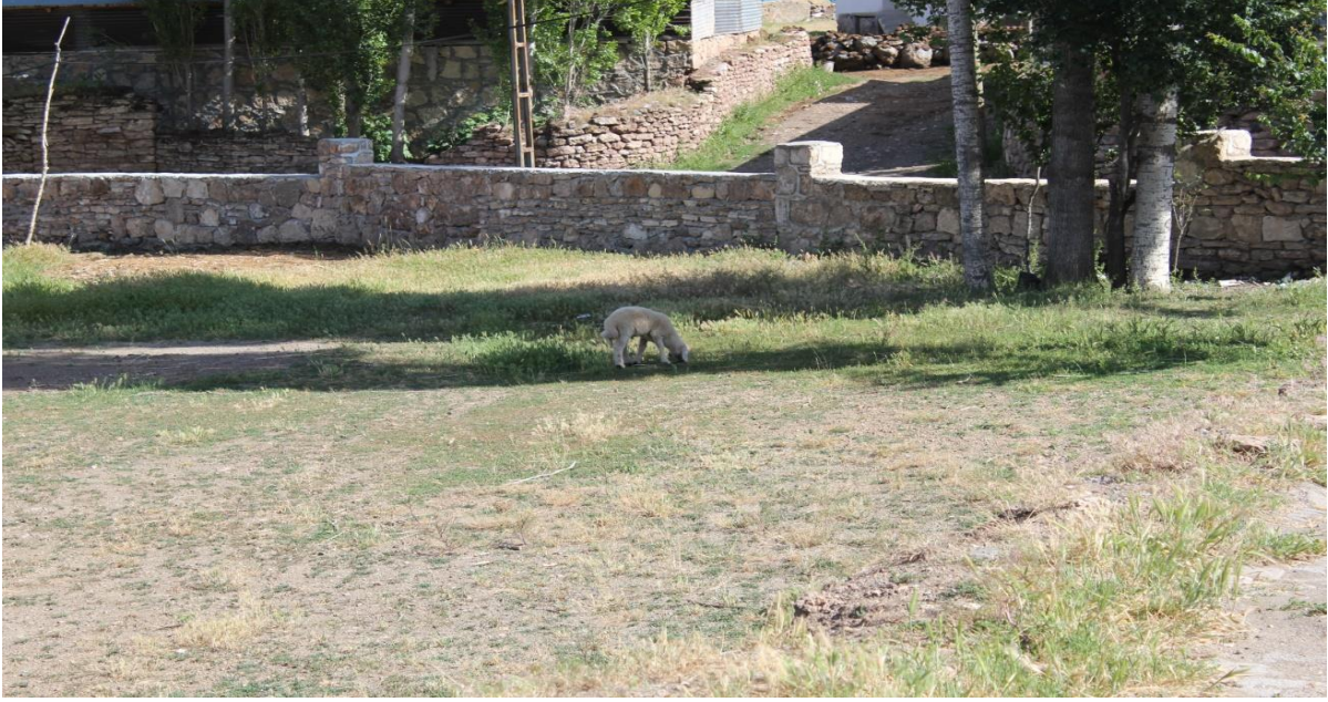
Resim 4: Beldenin İinden Grnm