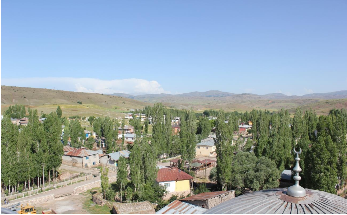
Resim 15: Beldenin Genel Görünümü