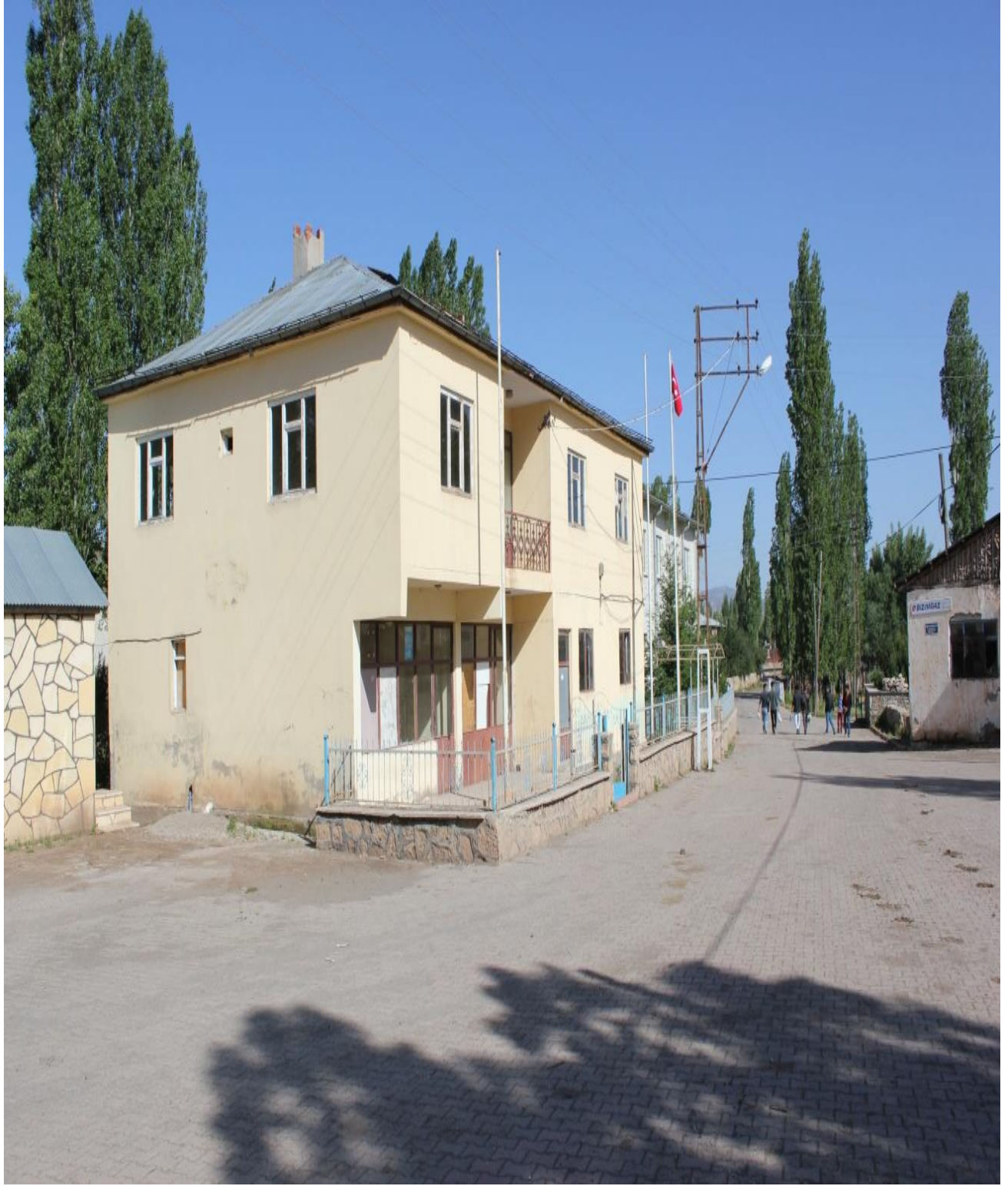
Resim 17: Beldenin Eski Kahvesi