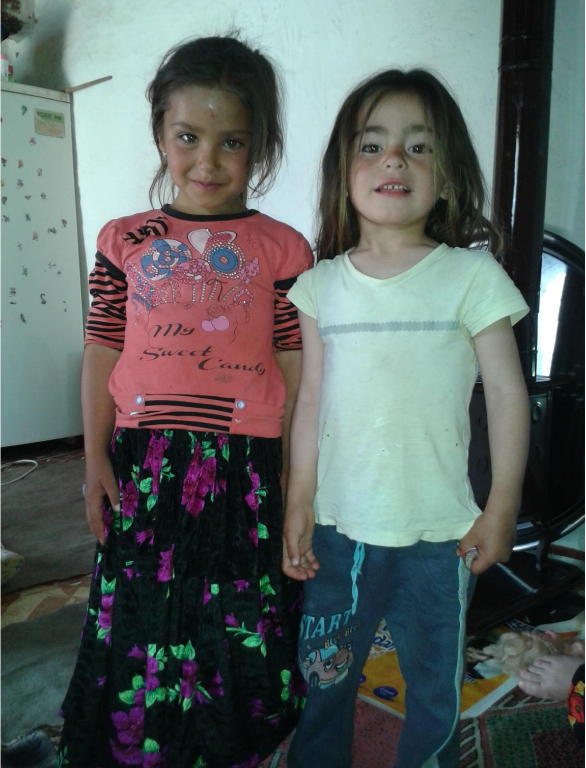
Resim 22: Beldedeki Çocuklar