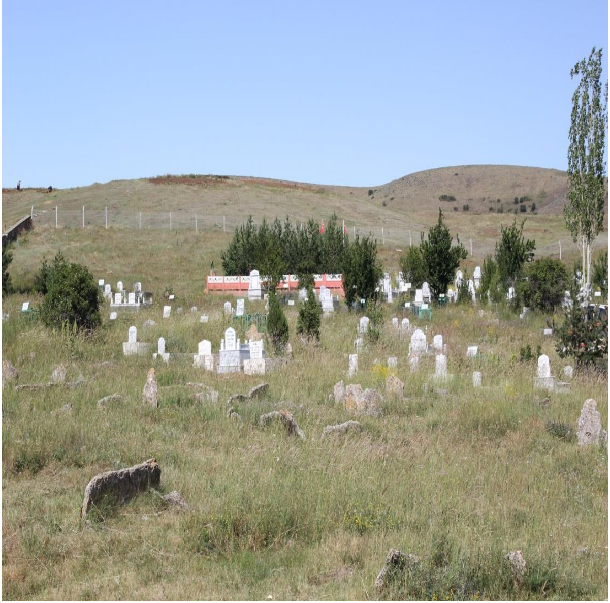
Resim 9: Beldenin Mezarlığı