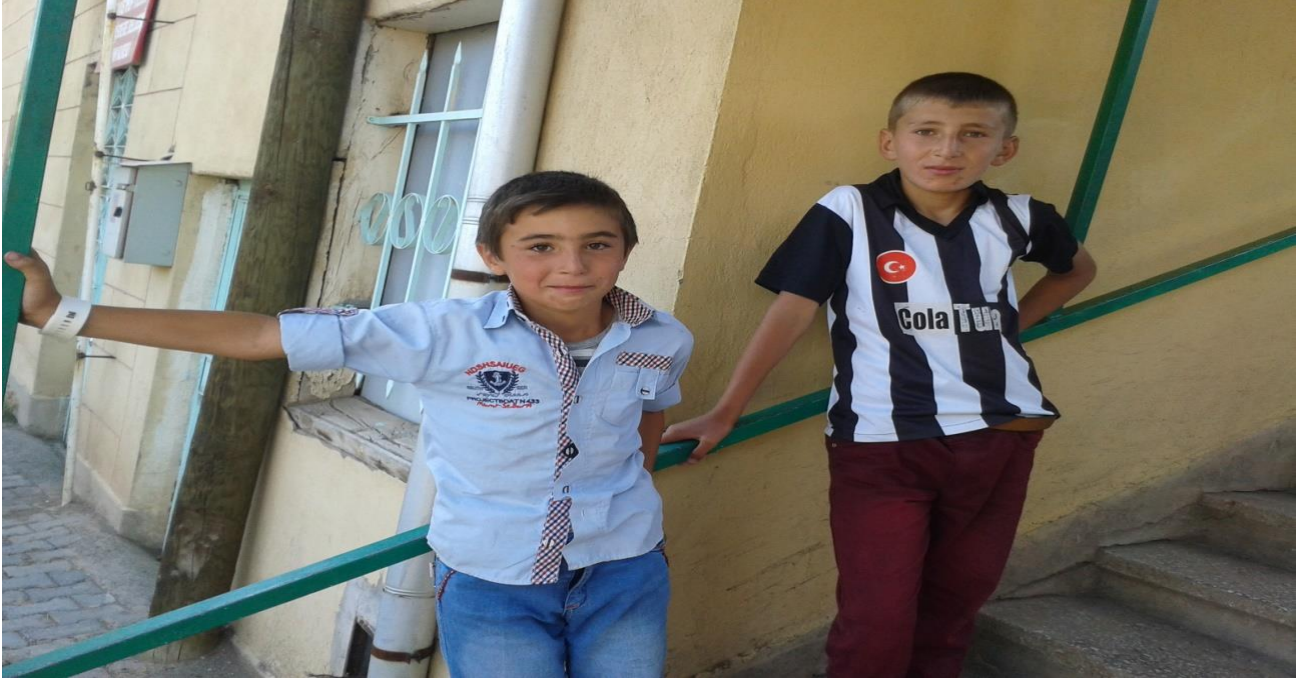
Resim 23: Beldedeki Çocuklar