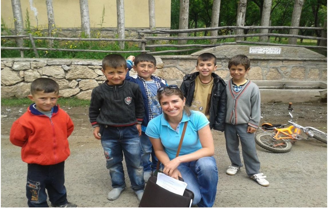
Resim 24: Beldedeki Çocuklar ve Yardımcı Araştırmacı