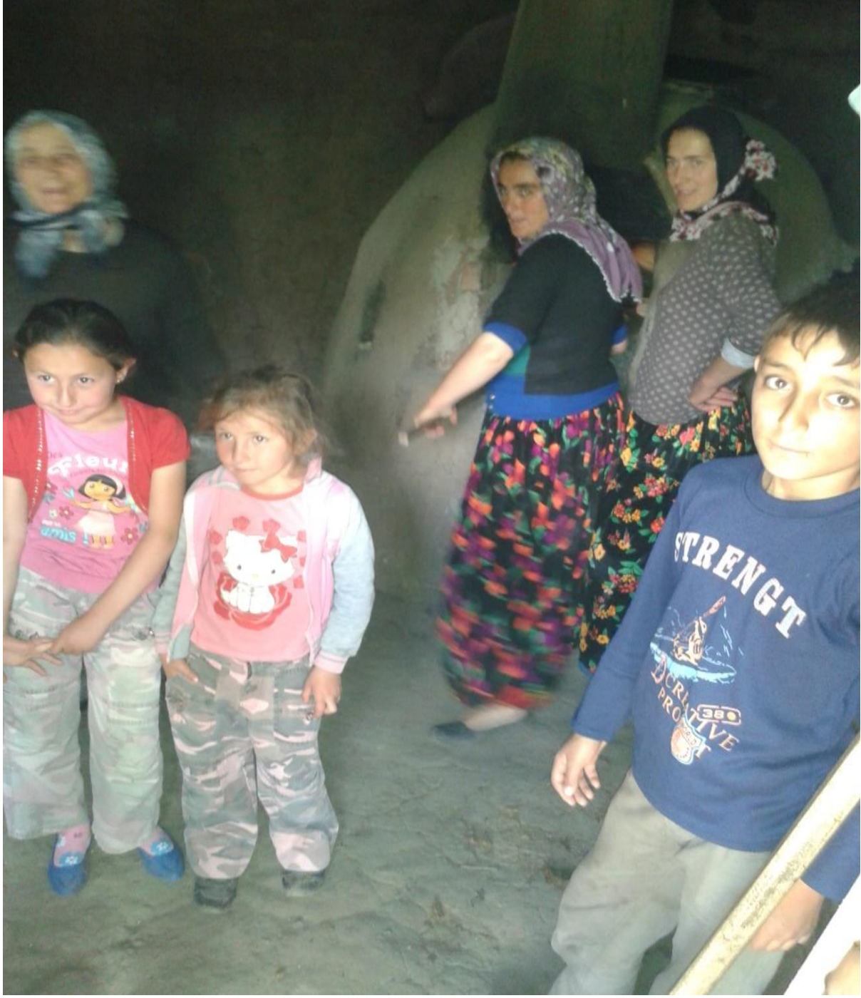
Resim 18: Belde de Ekmek Yapan Kadınlar