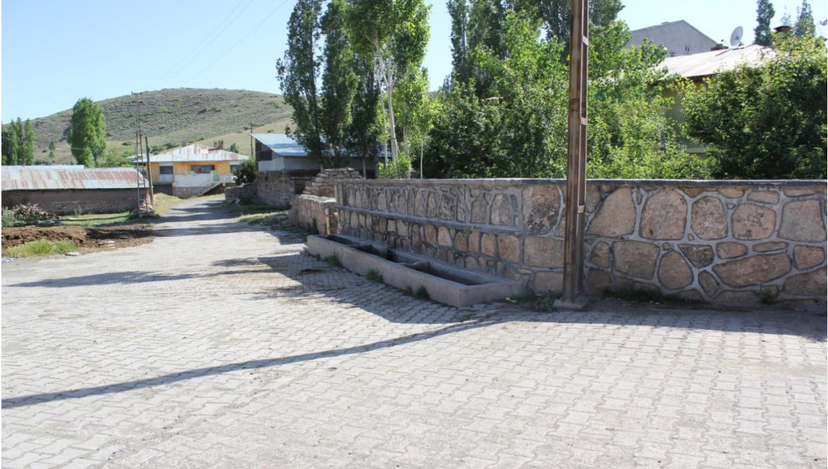
Resim 5: Belden Bir Grnm