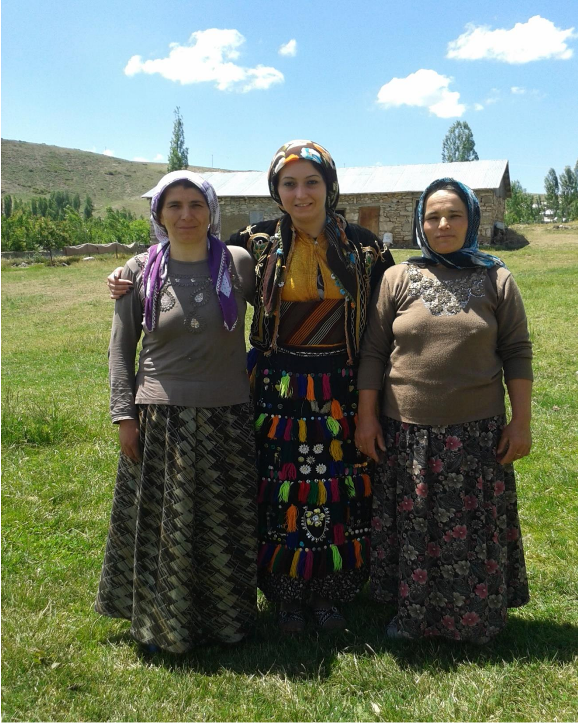
Resim 19: Belde de Yaşayan Kadınlar ve Araştırmacı