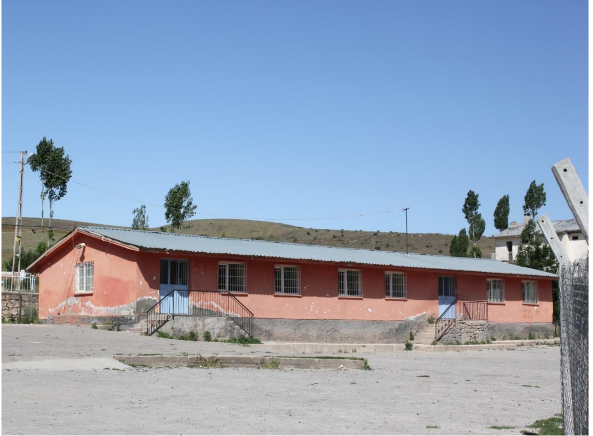
Resim 8: Belden Bir Görünüm