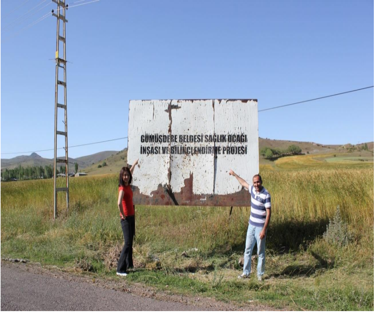
Resim 2: Beldeye Gidiş Yolu