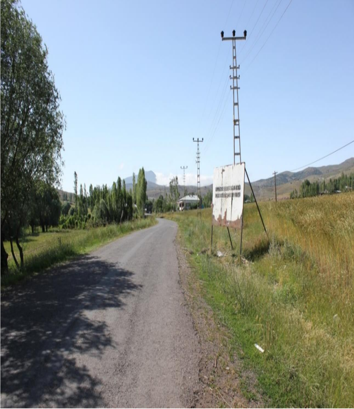
Resim 1: Beldeye Gidiş Yolu