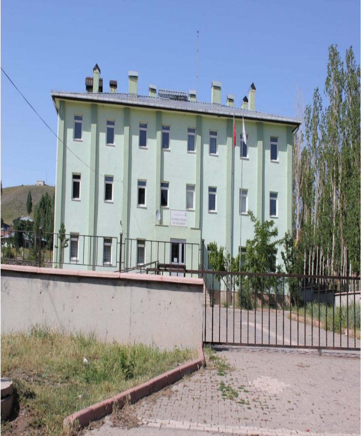
Resim 13: Beldenin Saęlık Ocaęı