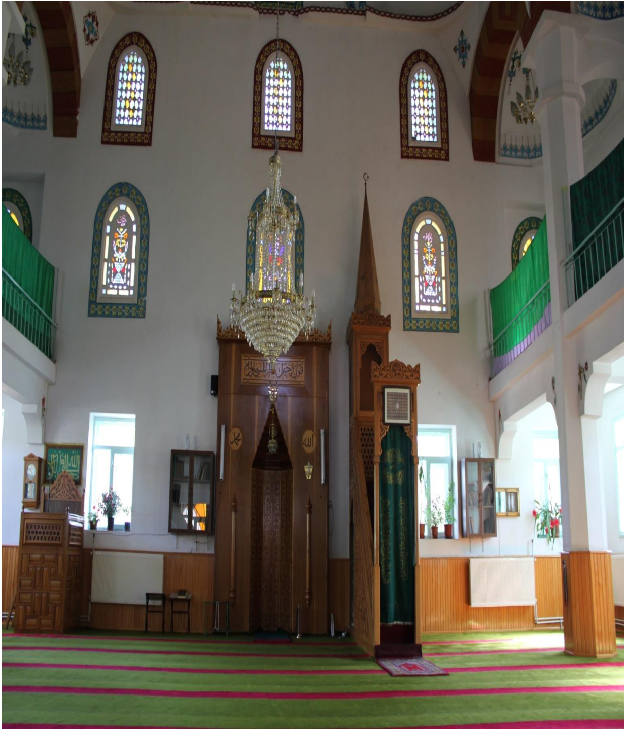
Resim 11: Beldedeki Caminin İinden Bir Kare