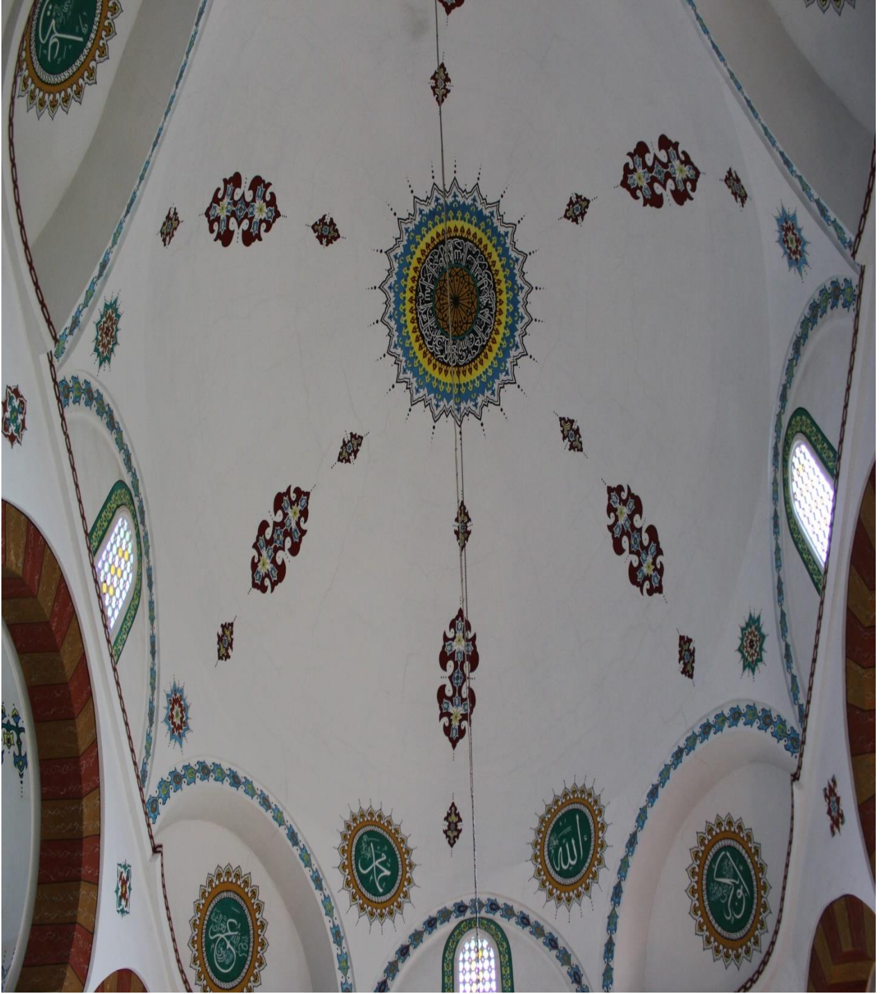
Resim 12: Belde Camisinin İçi