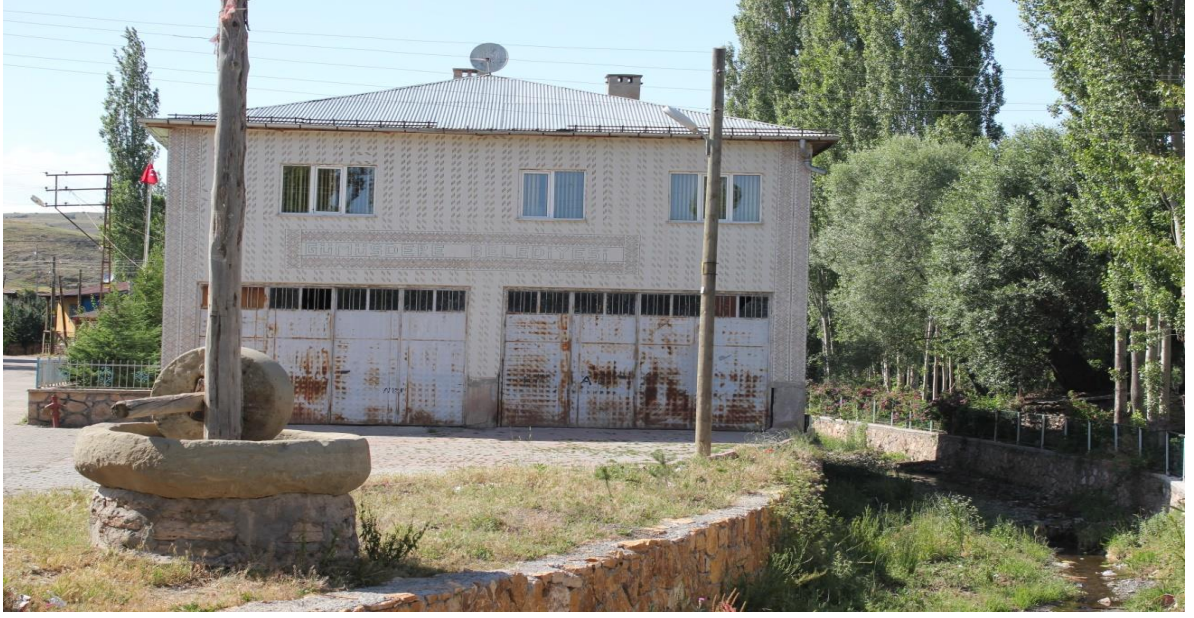
Resim 7: Belden Bir Görünüm