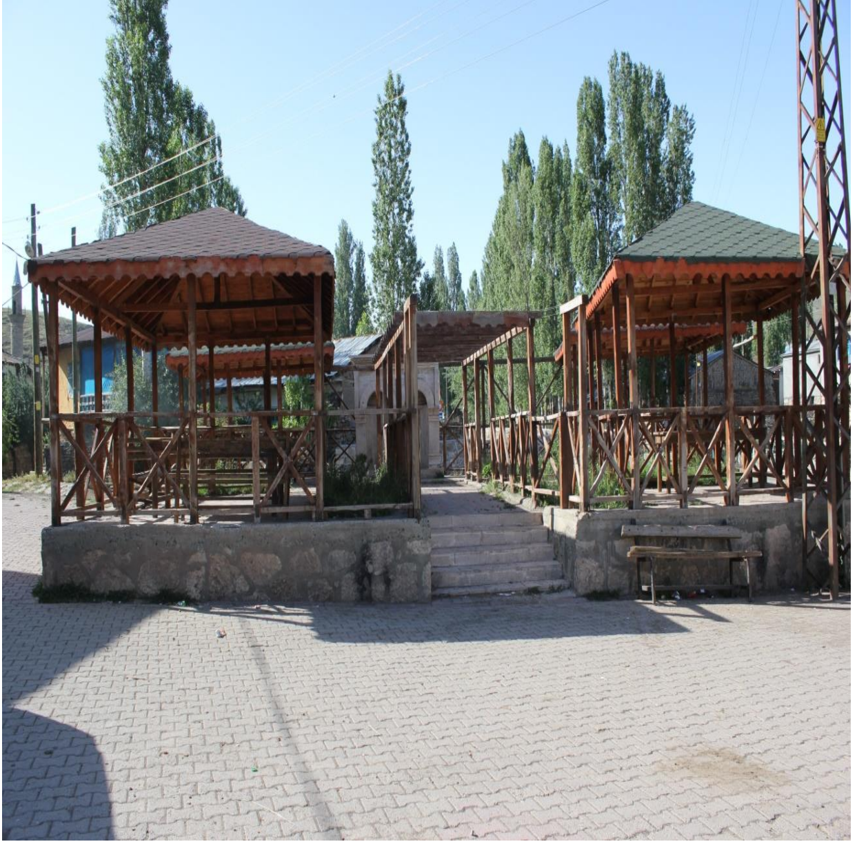
Resim 3: Beldenin Oturma Alanı