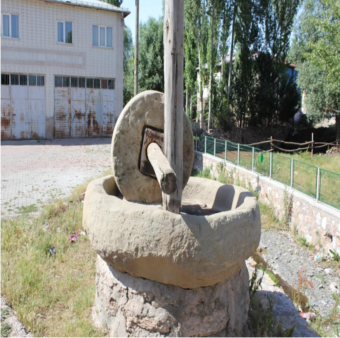
Resim 6: Belden Bir Görünüm