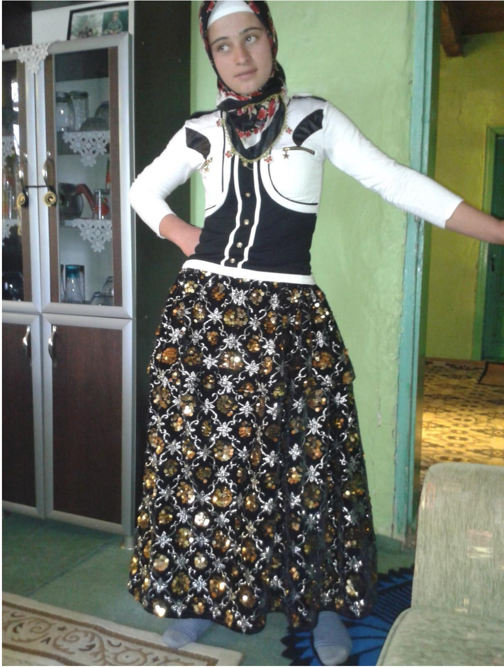
Resim 20: Beldede Düğün Kıyafetleriyle Genç Kız