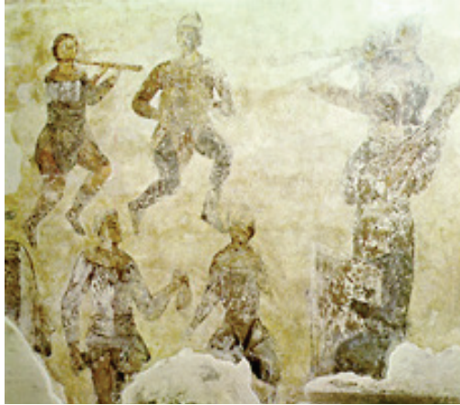
Şekil 5. 10. ve 11. yy a ait resimler. ( https://musicedresource.wikispaces.com )