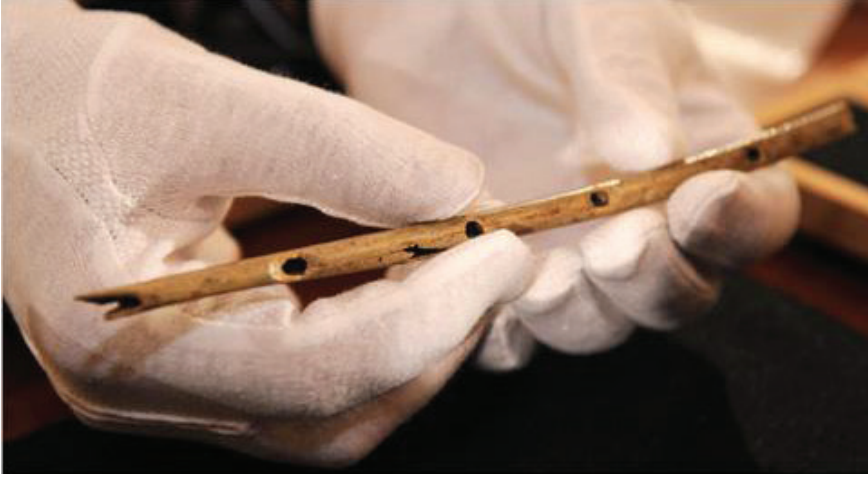
Şekil 3. Arkeolog Conard tarafından 12 Parça Halinde Bulunmuş Flüt( Karagöz, 2011:57)

duğundan Conard işlevselliğini test etmek için aynı cins kemikten flütün birebir kopyasını oluşturmuştur.”