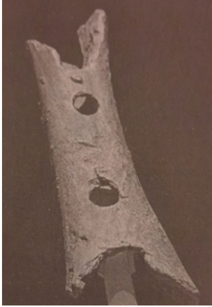
Şekil 1. Divje Babe Kemik Flütü (Masalcı Şahin, 2020: 88)

Doğduğu andan itibaren ses üretmeye başlayan insan sesleri farklı biçimlerde üretmenin yollarını da bulmuştu. Tarihin ilk flütleri kim bilir daha hangi malzemelerden üretildi .Doğanın şarkısını taklit etme çabasını güden insanların doğal bir gayretinin sonucuydu üfleme eylemi. Kimi zaman ağaç kovuğuna, bambuya,bulduğu boş bir kemik parçasına, kimi zaman da herhangi bir deniz hayvanının kabuğuna üfledi insanoğlu. Şekil 1’de Neandertal insanların yaptığı kemik flüt gösterilmiştir. Bu flüt üzerinde yapılan hesaplamalar, deliklerin doğru notalarda ses verecek biçimde ustalıkla açıldığını göstermiştir.