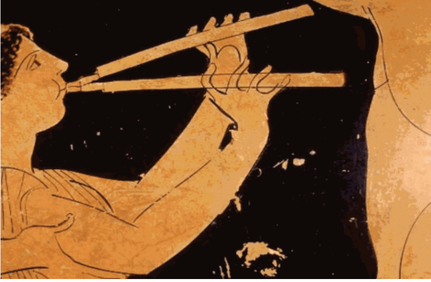
Şekil 4. Aulos Çalan Müzisyen(www.hafif.org)

“Yunanlılar antik yunan döneminde ‘Phontix’ adını verdikleri flüt resmi Perusa yakınlarında Etruskan kabartması olarak bulunduğu ve II. yy. başlarında yapıldığı bilinmektedir. O döneme ait bulunan kabartmalar, el yazmaları bunu belirtmektedir. O döneme ait madeni paraların çoğunda görülen flüt kabartmaları da flütün ne derece benimsendiğini kanıtlar niteliktedir. Antik yazarların günümüze kadar ulaşan eserleri aynı zaman da antik dönemlerde flüt hakkında bilgi edinmemizi sağlayan yazılı kaynakları oluşturmaktadır. Platon İdeal Devlet adlı eserinde flüt ile ilgili şu şekilde bilgi vermektedir: