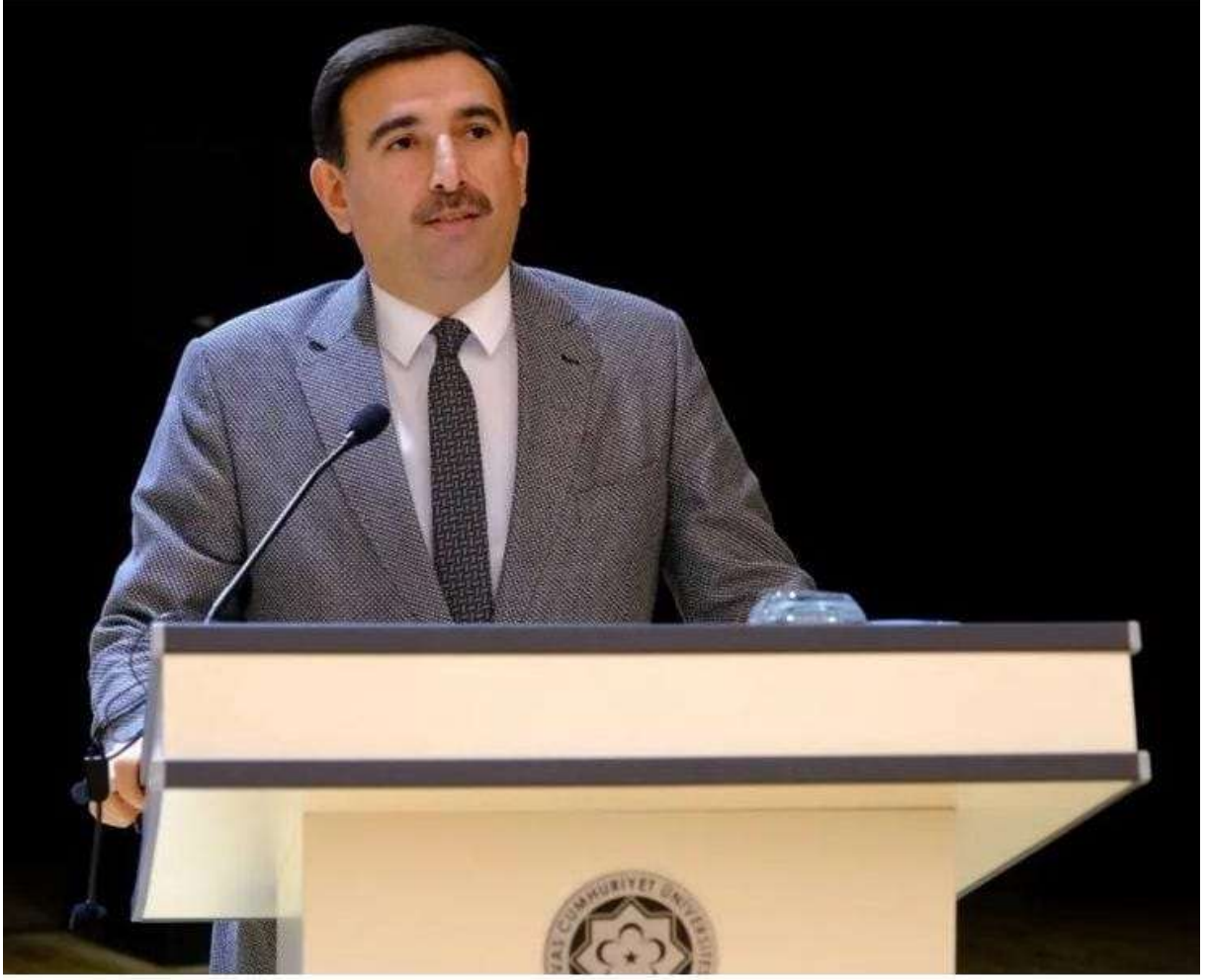
Sivas Belediyesi Başkan Yardımcısı Turan TOPGÜL'ün Açılış Konuşmaları