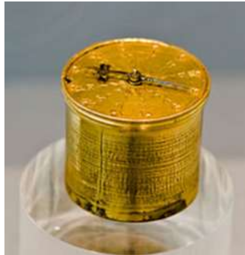
Şekil:2 Nürnberg Yumurtaları