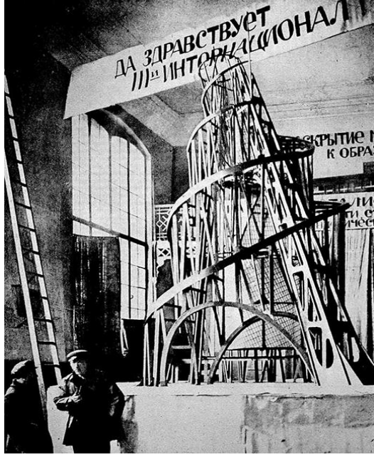
Görsel 2. Vladamir Tatlin, 1919, Üçüncü Enternasyonal Anıtı Tasarımı