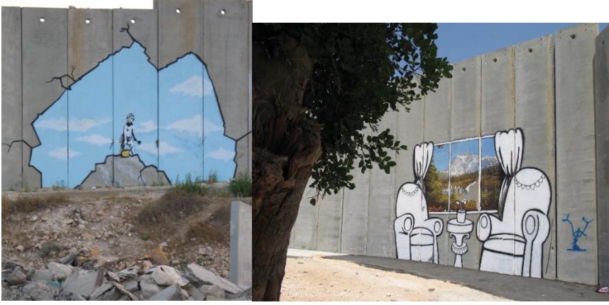
Görsel 3. Banksy ile Dünyayı Bombalamak

duvarda dokuz çalışması bulunmaktadır. Çalışması insanlık tarihinin ayrımcı, dışlayıcı, ötekileştirici gibi kavramları konu edinmiştir. Tarihsel, sosyal, kültürel etkileşimleriyle aralarındaki setlerin yıkılması, kişilerin her an başka veya yepyeni kültürleri tanınması ve başka kimlikler kazanmasını sağlar. Böylece karakterlerimiz, kimlik ve kişiliklerimiz yeni kimlik, karakter ve kişiliklerle de eklemlenebilir (Türkdoğan, 2014, s. 141).