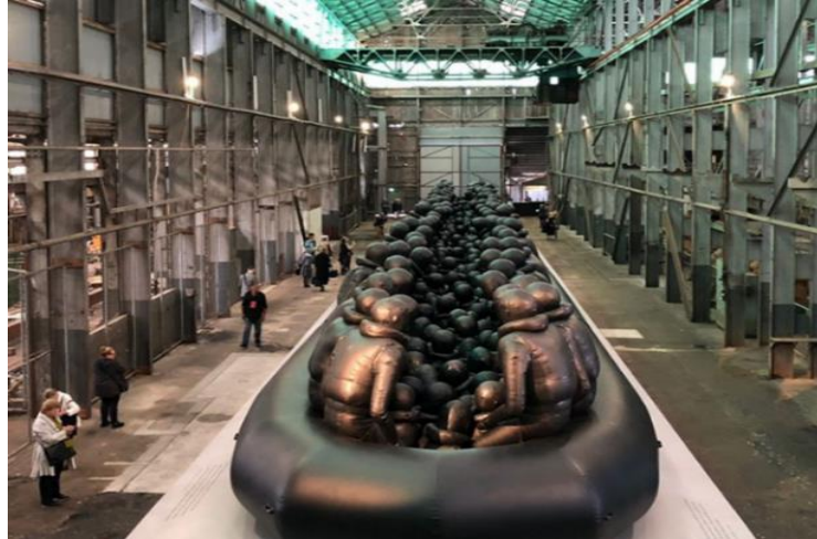
Görsel 3. Yolculuğun Kanunu/Seyahat Hakkı/ “Law of Journey/Seyahat Hakkı” AiWeiwei, 21.Sydney