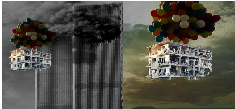
Görsel 4. Tammam Azzam, Bon Voyage:New York, 2013.

Tammam Azzam, ülkesindeki çatışmalar ve savaştan dolayı ülkesini terk etmek zorunda kalarak önce Dubai'ye oradan da Almanya'ya göç etmiş bir Suriye yakın dönem sanatçısıdır. Azzam, hibrit bir sanat anlayışına sahip olmakla beraber melez bir form inşa etmiştir. Bundan dolayı yakın dönem çalışmalarında, ülkesindeki politik ve toplumsal karışıklıkları ve Suriye'yi büyük yıkımlara götüren şiddet sarmalını araştırmak amaçlı dijital medya ve sanat tarihinde yer alan önemli çalışmalardan referanslar bulunmaktadır. Azzam, global ikonografiden (medyalaştırılmış görseller, sanat tarihine referanslar vb.) alıntılar yaparak veya esinlenerek dijital biçimlerini sosyal bağlantılarla sistemli bir şekilde paylaşmaktadır. Sanatçının Suriye Müzesinde yer alan çalışmaları, Suriye gerçekliğini kıyaslamakta, güncel gelişmelere veya konulara ilgiyi, anlayışı ve görünümü analiz etmekte ve sanatın sorgulayıcı özelliğini ortaya koymaktadır ( https://en.syriaartasso.com/artists/tammam-azzam/ ).