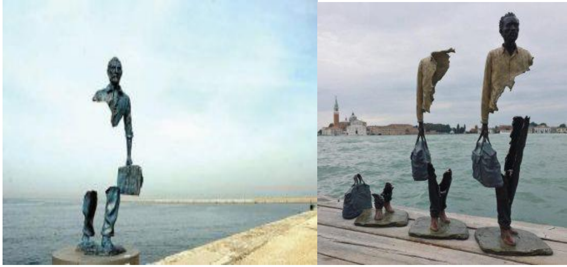
Görsel 6: Bruno Catalano, 2013, Marsilya, Fransa, Gezinler serisinden