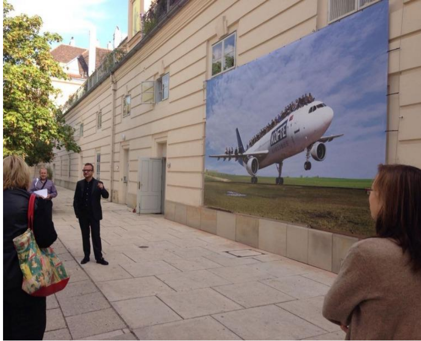
Görsel 1. Halil Altındere, Köfte Airlines, Viyana, 2016, Fotomontaj.

Sergide yer alan "Köfte Airlines" çalışmasında Altındere, İstanbul-Tekirdağ yolu güzergahında yer alan bir uçak restoranı mekan olarak kullanmıştır. Altındere daha önceden görüştüğü 45 mülteciyi, restoran formuna dönüştürülmüş bir uçağın gövdesinin üstüne konumlandırarak fotoğraflamıştır (Hanson, M. 2018). Çalışmada Altındere, günümüz sanat pratikleri anlayışıyla uyumlu olarak, ne ile yapıldığının değil neden yapıldığı ve hangi önemli sosyal mesajı, mantığı içinde barındırdığı vurgusunu öne çıkaran bir sanatsal pratikle göç ve göçmen sorunsalını gözler önüne sermeyi amaçlamıştır (Çeber, 2018; Elmas & Erikan, 2022).