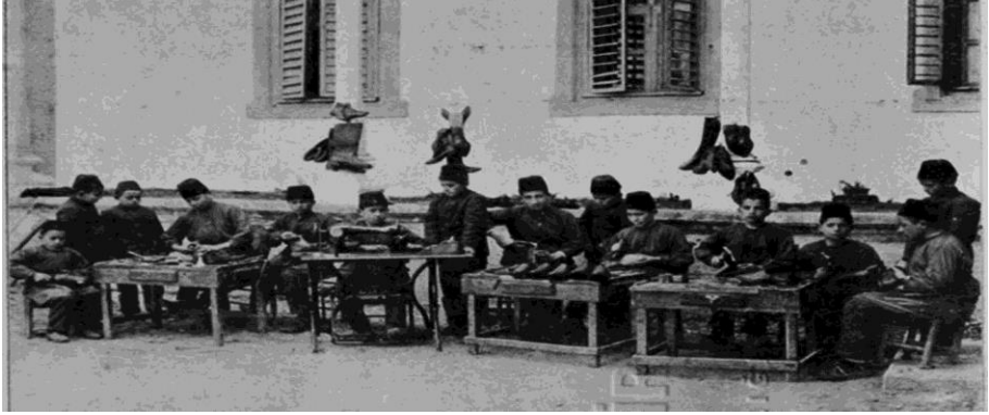
Resim 6. Sivas Sanayi Mektebi Kundura atölyeleri

Sanayi mektebinde sadece Müslüman çocukların olmadığı ve vilayetin toplumsal yapısında farklı dinsel kimliklerin yer aldığı sonucuna ulaşılmaktadır.