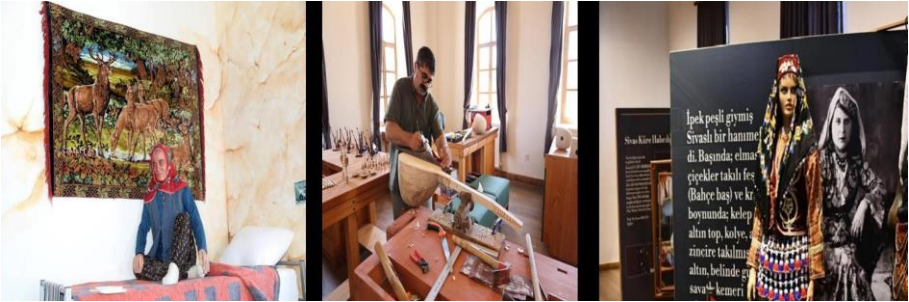
Resim 15. Sivas Sanayi, Müzesi