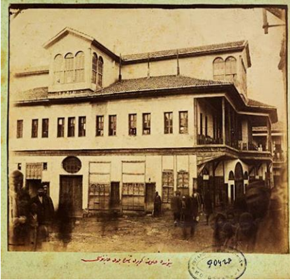
Resim 3. Sivas Rüştîye Mektebi

bu çocuklardan bir takımı terzi, bir takımı kunduracı olarak yetiştirilmek için ustaların yanına verilmiştir. Her gün sabahtan Kur 'an, ilmiyal ve itikad meseleleri ile dört saate kadar talim ve telkin olunduktan sonra, herkes ustalarının yanında zanaat etmekte olan ve bu yolda tutulan güzel tedbirler, kıyafet düzgünlüğü semeresini vermiş, imal ettikleri kundura, şal ve diktikleri elbise şayan bulunmuştur.” ifadelerine yer verilmiştir.