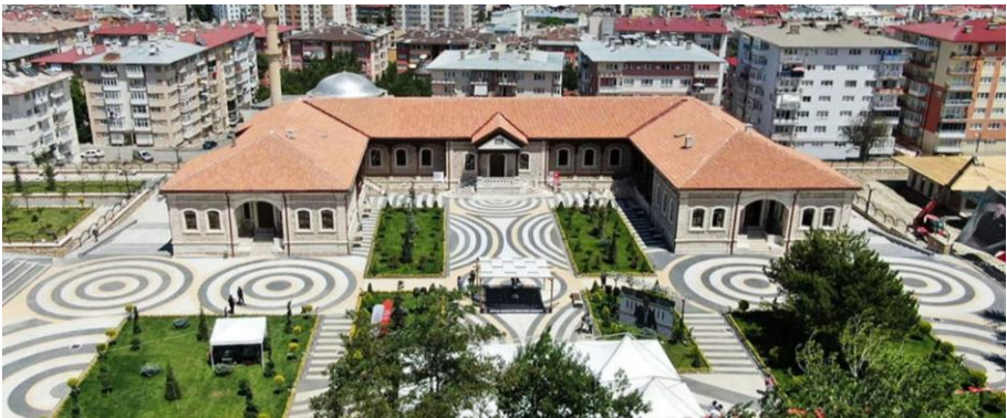
Resim 22. Aaaaaaaa