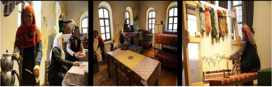
Resim 14. Sivas Sanayi, Müzesi