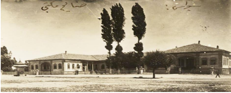
Resim 8. Sivas Sanayi Mektebi

Sanayi Mekteplerinin genel yapısında uygulanan iki farklı eğitim programı bulunmaktadır. Bunlardan ilkinde genel kültür ile ilişkili dersler yer almaktadır. Bu dersler genel olarak sabah saatlerinde verilmiştir. İkincisi ise mesleklerle ilgili olan derslerdir (Yücel-Mutlu, 2007).