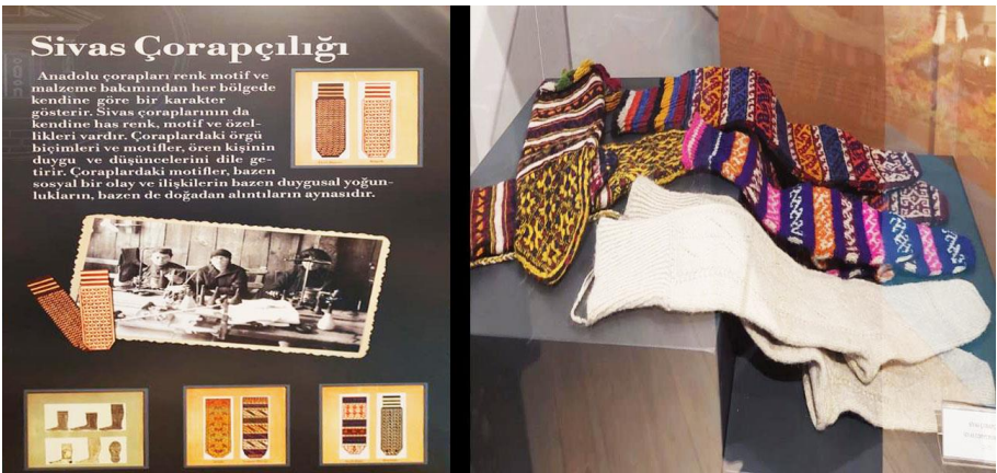
Resim 19. Aaaaaaaa