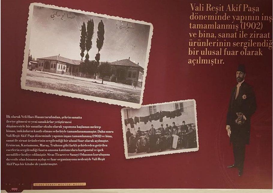
Resim 11. Sivas Sanayi, Müzesi

gibi geleneksel el sanatlarına yönelik uygulama atölyeleri ve hizmet birimleri yer almaktadır. Müze bugünkü kullanımıyla hem şehre hizmet verecek yeterliğe sahiptir. Hem de hem yurt içi hem de yurt dışından gelen turistler için ilgi çekici bir ziyaret alanı olarak hizmete sunulmuştur. Kurulan bu müzenin tanıtılması için gerekli çalışmaların yapılması gerekmektedir. Müzenin kurulduğu alanın etrafında yer alan Sivas Arkeoloji Müzesi, Sivas Zanaatkarlar Çarşısı ve Müzesi ile bütünlük göstermektedir.