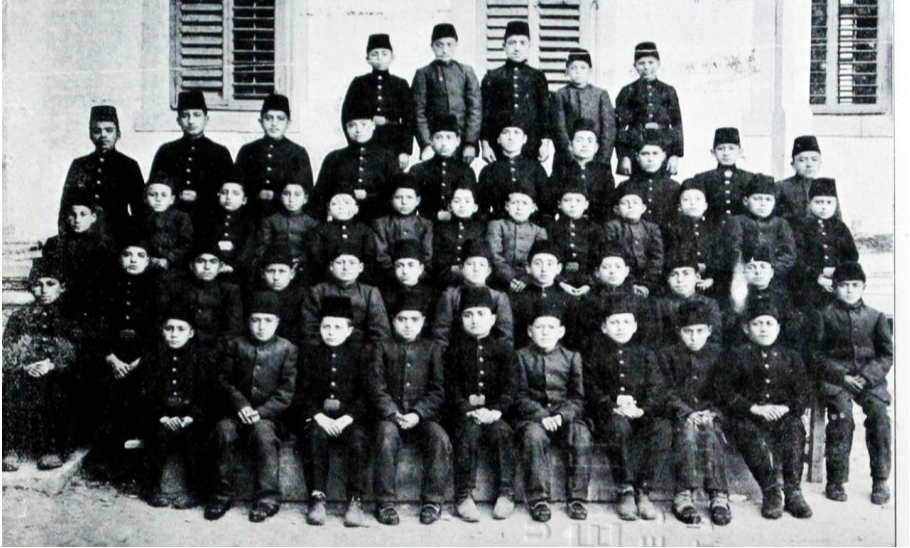
Resim 7. Sivas Sanayi Mektebi Talebeleri: Sâlnâme-i Vilâyet-i Sivas adlı kitaptan alınmıştır (Yücel, 2011).

Sivas'ta açılan sanayi mektebinde halıcılık diğer mesleklere kıyasla önemli yer tutmuştur. Sivas Sanayi mektebinde görevlendirilen öğretmenler genelde Darümuallimin mezunları arasından seçilmiştir. Mektepteki zanaat derslerine ise bölgede bulunan işinin ehli ustalar seçilerek ders vermeleri sağlanmıştır. Mektebin birinci sınıfını bitirenlere çıkarılık belgesi, ikinci, üçüncü, dördüncü sınıfını bitirenlere kalfalık belgesi ve mezun olanlara ise ustalık şهادetnamesi verilmiştir. Sivas Sanayi mektebinde sadece eğitim vermemiş aynı zamanda çevreden gelen talepler doğrultusunda üretim de yapılmıştır. Mektep bünyesinde atölyeler olduğu için gelen siparişler kabul edilmiştir. Bu atölyelerde üretilerek yerine getirilen siparişlerden elde edilen gelirin bir kısmı okulun ihtiyaçları için kul-