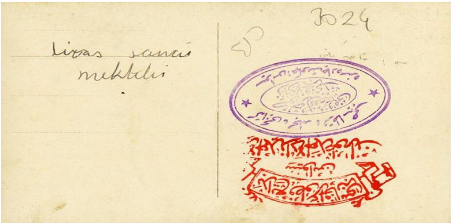
Resim 9. Sivas Sanayi Mektebi Kararı

Genel kültür derslerinden Arapça, Farsça, Kur'an-ı Kerim, ulûm-ı diniye, hesap, kavaid-i Osmani bütün Sanayi Mekteplerinin teorik programlarında yer almıştır. Osmanlı İmparatorluğu'na bağlı bazı vilayetlerde ise Fransızca, kozmografya, kitabet, Türkçe, tarih, coğrafya, hendese, cebir, kimya, resim-i hendese, resim, makine, malûmat-ı fenniye gibi dersler de öğretim programlarına eklenmiştir. Mesleki dersler ise; demircilik, marangozluk, terzilik, kunduracılık, dokumacılık, litografyacılık (taş baskıcılığı), tesviyecilik, mücellitlik (ciltçilik) (Yıldırım, 2010).