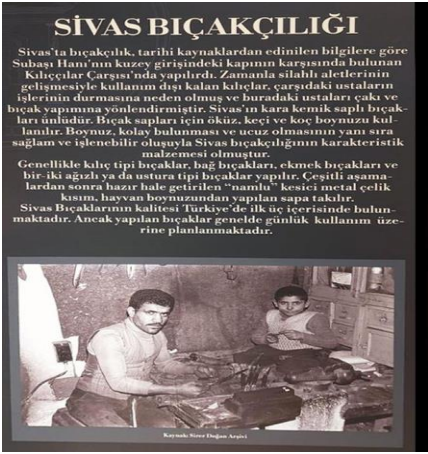
Resim 20. Aaaaaaaa