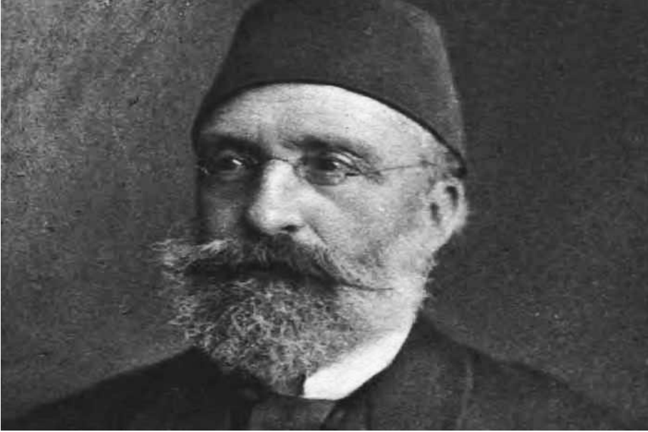
Resim 2. Mithat Paşa

haneler açılmıştır (Karataşer, 2017; Koçer, 1991). İslahhanelerin hepsinde mesleki anlamda aynı eğitim değil bölgenin ihtiyacı olan mesleki eğitimlerin verilmesi ve bölgede üretilen ürünlerin dikkate alınması öncelenmiştir. Niş'te açılan bir ıslahhanede çocuklara terzilik, kunduracılık, fotoğrafçılık ile ilgili eğitim verilirken Rusçuk'ta açılan ıslahhanede bölgede kurulan araba fabrikasına nitelikli ustalar yetiştirilmesi amacıyla makinistlik eğitimleri verilmiştir. Sofya'da açılan ıslahhanede ise yine bölgede kurulan çuha fabrikasının nitelikli eleman ihtiyacının karşılanması amacıyla dokumacılık eğitimleri, Konya'da açılan ıslahhanede halıcılıkla ilgili eğitimlere ağırlık verilmiştir (Karataşer, 2017). İslahhaneler ilk başlarda sadece erkek çocuklarına yönelik olarak açılmakla birlikte 1865 yılında Rusçuk vilayetinde kimsesiz ve fakir kız çocukları için de bir ıslahhane açılmıştır (Koçer, 1991).