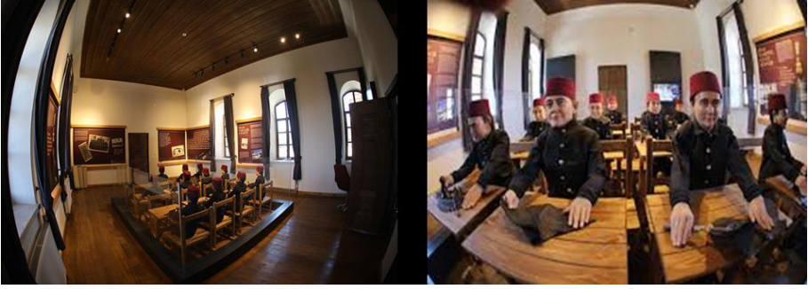
Resim 13. Sivas Sanayi, Müzesi