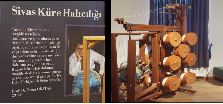
Resim 17. Aaaaaaaa