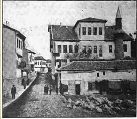
Resim 4. Sivas Rüştîye Mektebi

Mektebin kendi döneminde işlevini başarılı bir şekilde yerine getirdiği belirtilmiştir (Yücel, 2011). Açıklamalarda görüldüğü gibi bu mektepte eğitim gören çocukların tamamen zanaatkâr olmaları için gereken çaba gösterilmiştir. Bu bağlamda Sivas ilinin zanaat konusunda ihtiyacını karşılamaya yönelik olarak çalışma yapıldığı ifade edilebilir. Sivas vilayetinde bir Sanayi Mektebinin kurulması planlanmış ancak bu planlandığı dönemde gerçekleştirilmemiştir. Sivas Sanayi Mektebi için bir bina yapılmış ve 1894 yılında tamamlanmıştır. Ancak aynı yıl bir deprem olmuş ve Askeri Rüştîye binaları bu depremde ciddi hasar görmüştür. Yeni tamamlanan Sivas Sanayi Mektebi binasının Askeri Rüştîye binası olarak kullanılması yönünde karar alınmıştır. Dolayısıyla da bina tahsis olmadığı için Sivas Sanayi mektebi o yıllarda eğitim ve öğretime açılmamıştır (Akpınar & Birol, 2015; Birol, 2004).