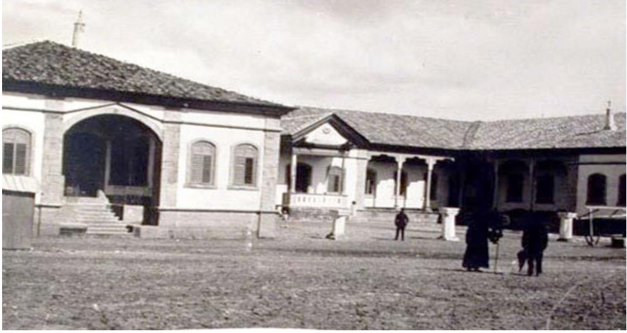
Resim 10. Sivas Sanayi Mektebi'nin kadın cezaevi olarak kullanıldığı dönem

Mektep, 49 yıl bu amaca hizmet ettikten sonra 1951 yılında cezaevine dönüştürülmüş ve 68 yıl da kadın cezaevi olarak kullanılmıştır (Bulut, 2006). 68 yıl boyunca kadın mahkûmlara hizmet veren binanın 2019 yılında müze haline getirilmesi kararı alınmıştır. Kurulan müzenin hem binanın tarihini yansıtmaması hem de günümüzde etkin bir eğitim ve öğretim alanı olması için çalışmalar yürütülmüş ve doğrultuda çalışmalar yürütülmüştür. Kurulan müzede farklı eğitim amaçları için kullanılacak birçok bölüm bulunmaktadır. Ayrıca müzede geleneksel el sanatlarının öğrenilebileceği atölyeler de yer almaktadır. Her kademedeki öğrenciler için okul dışı öğrenme alanı olarak kullanılabilen müzenin bu yönünün öne çıkarılması gerekmektedir.