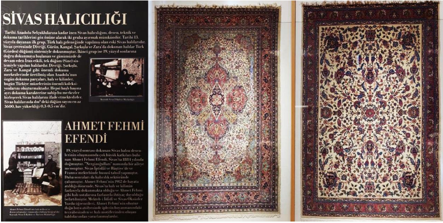
Resim 18. Aaaaaaaa