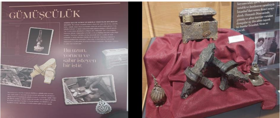
Resim 16. Aaaaaaaaa