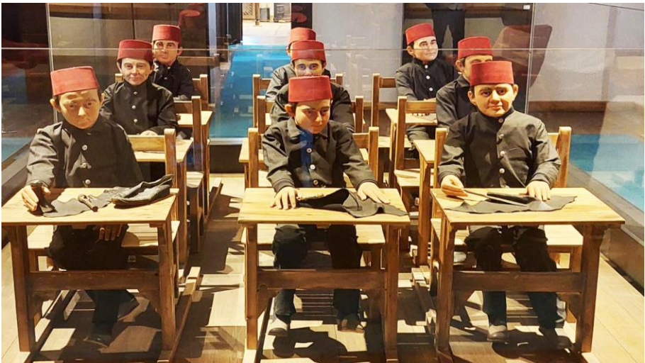
Resim 12. Sivas Sanayi, Müzesi