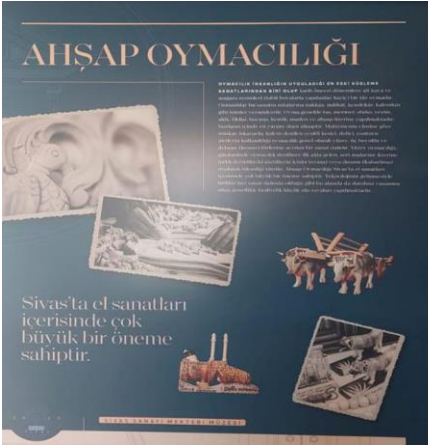
Resim 21. Aaaaaaaa