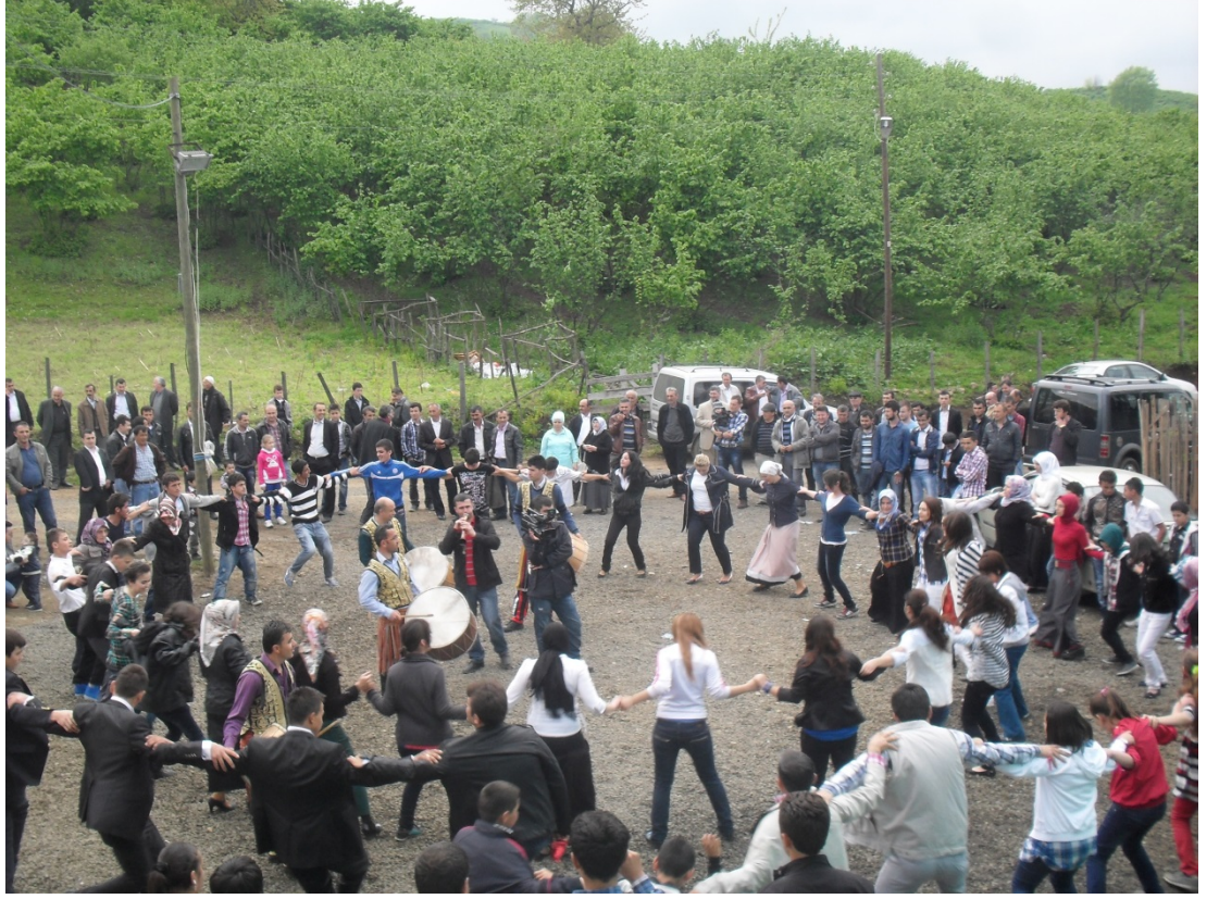
Düğünden bir kare(2013)