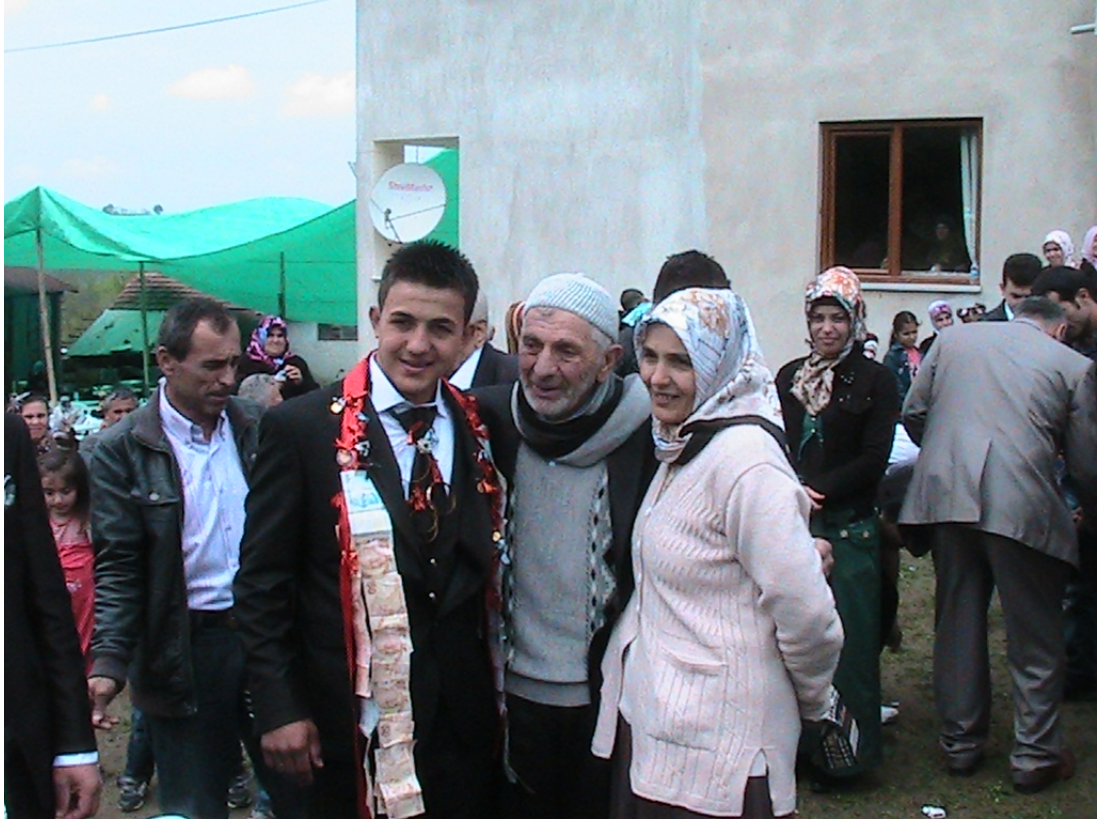
Damat bahşışı (2013)