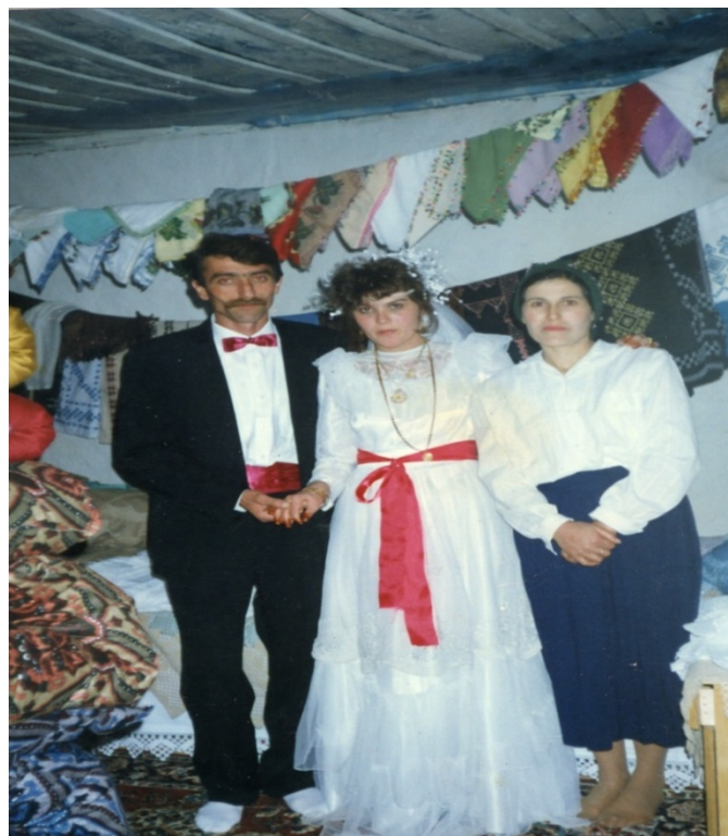
Ek 17: Duvak (1990)