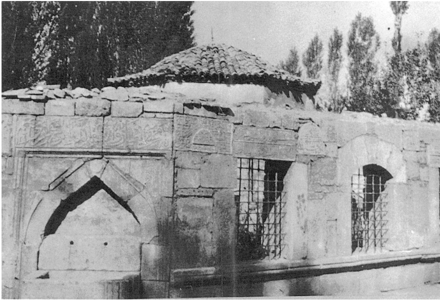
(Fotoğraf: 6) Numan Efendi Haziresi'nin 1910'lu yıllardaki görünüşü (Hazirenin arkasında Numan Efendi Kütüphanesi'nin kubbesi görünmektedir.)