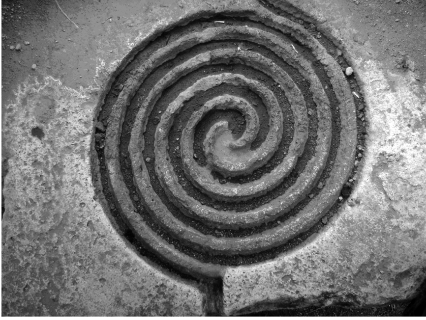
(Fotoğraf: 7) Hazirenin iç kısmındaki iç içe daire biçimindeki altı adet kıvrımdan oluşan iki helezon