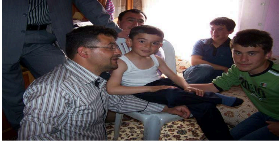
Resim 42: Sünnet öncesi sünnet çocuğunun etrafında babası ve çocuktan birkaç yaş büyük arkadaşları