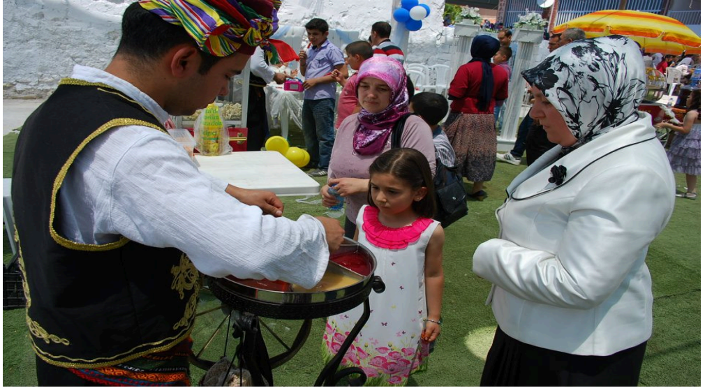
Resim 36: Törene renk katan çeşitli ikram ve gösteriler en çok çocuklara hitap etmektedir (www. akishaber.net).

Son yıllarda özellikle televizyon, radyo, internet gibi iletişim araçlarının gelişmesine paralel olarak bazı gelenekler başka yörelerden alınmaya başlanmış ya da bazı eski gelenekler tekrar canlandırılmaya başlanmış ya da törene renk katma adına yöresel kıyafetlerle şeker, şerbet, dondurma ikram edilme gibi adetler görülür olmuştur. Bu adetlerin çeşitlenmesinde ve farklılaşmasında son yıllarda törenler için tutulan organizasyon şirketlerinin payı da oldukça fazladır. Zira organizasyon şirketleri törenleri renklendirmek adına farklı gelenek ve adetleri gün yüzüne çıkartmaktadır.