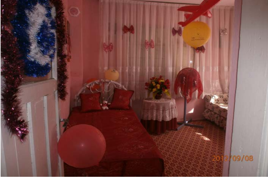
Resim 10: Bir sünnet odası

Sünnet odası sünnet çocuğunun annesinin dantel, oya, kanaviçe gibi hünelerinin sergilendiği mekândır. Dolayısıyla annenin el emeği göz nuru yaptığı işlemler, süslemeler sünnet düğününde ortaya dökülür ve sünnet odasında sergilenir. Bu işlemler annenin çeyizinden olabileceği gibi sünnet töreni için özel yapılmış işlemler de olabilmektedir.