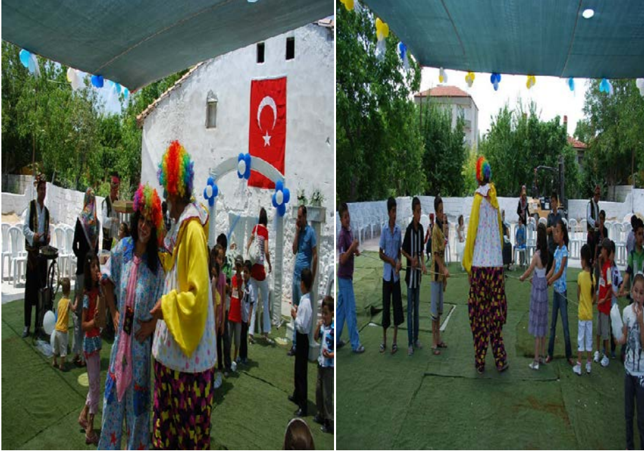
Resim 29: Denizli Kale İlçesi bir sünnet. Çocuklar için ayrılmış kısımda palyaço gösterileri ve oyunları.