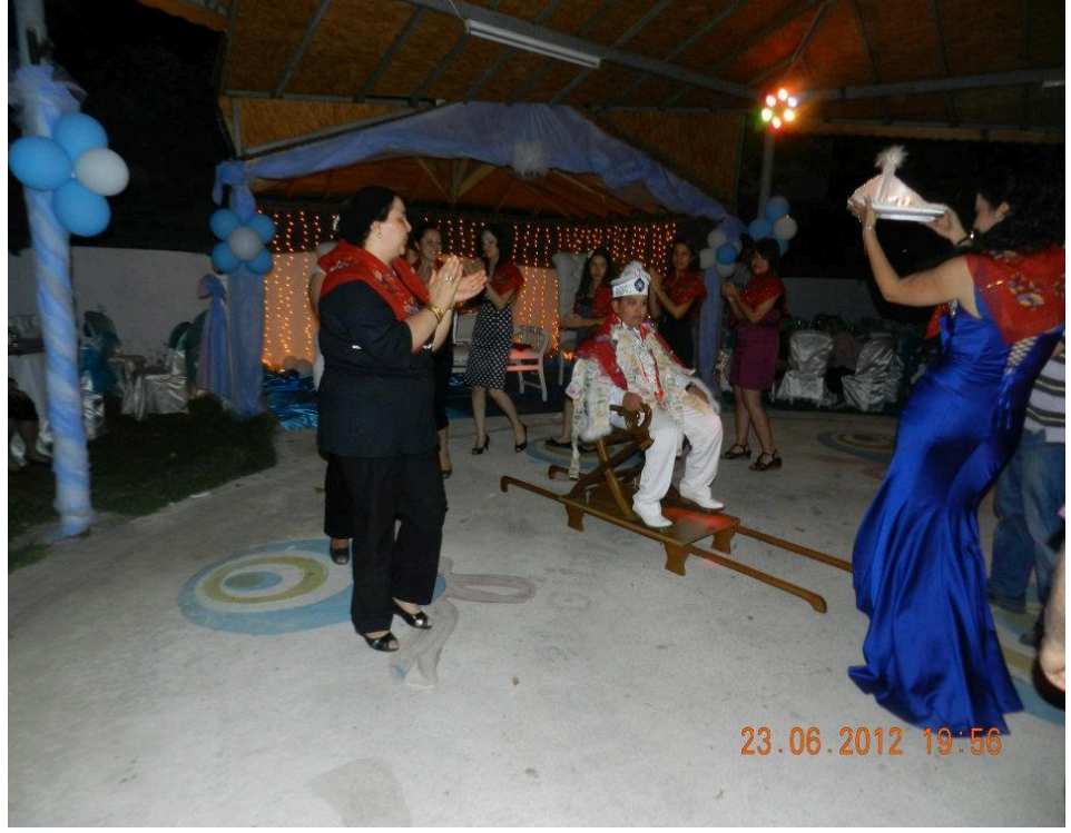
Resim 22: Düğün salonunda yapılan bir kına gecesi genç kızlar sünnet çocuğunun etrafında kına tepsisini gezdirirken

Sünnet kınası ile ilgili önemli hususlardan biri de sünnet kınasını yakan kişidir. Zira herkes sünnet çocuğuna kına yakma şerefine nail olamaz. Sünnet kınasını yakacak kişide bazı özellikler aranır. Bunlar ailesinin dağılmamış olması, mutlu bir evliliğinin olması, yakınlarından birini kaybetmemiş olması gibi özelliklerdir.