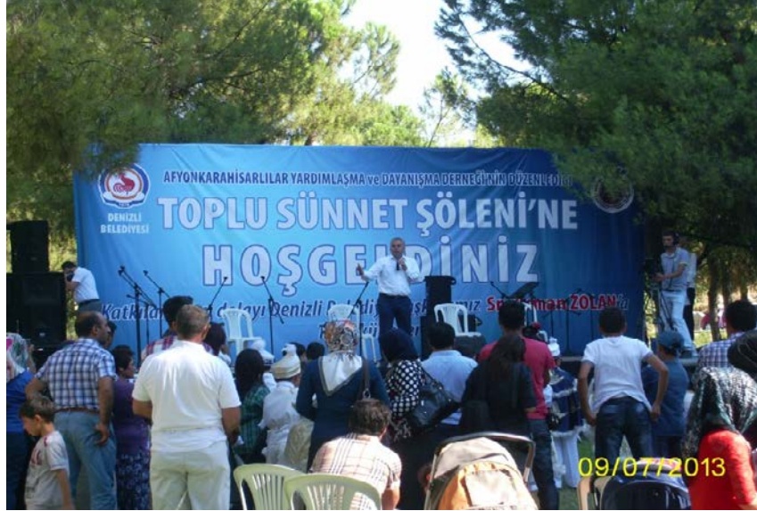
Resim 8: Denizli’de Afyonkarahisarlılar Yardımlaşma Derneği’nin tertip ettiği sunnet şöleninde Denizli belediye başkanı konuşma yaparken

çıkılmış Kur'ân'dan sureler ve mevlitler okumuş, töreni dua ile kapatmıştır. Daha sonra Denizli Belediyesince alınan bisikletler ve çeşitli hediyeler çocuklara hediye edilmiştir.