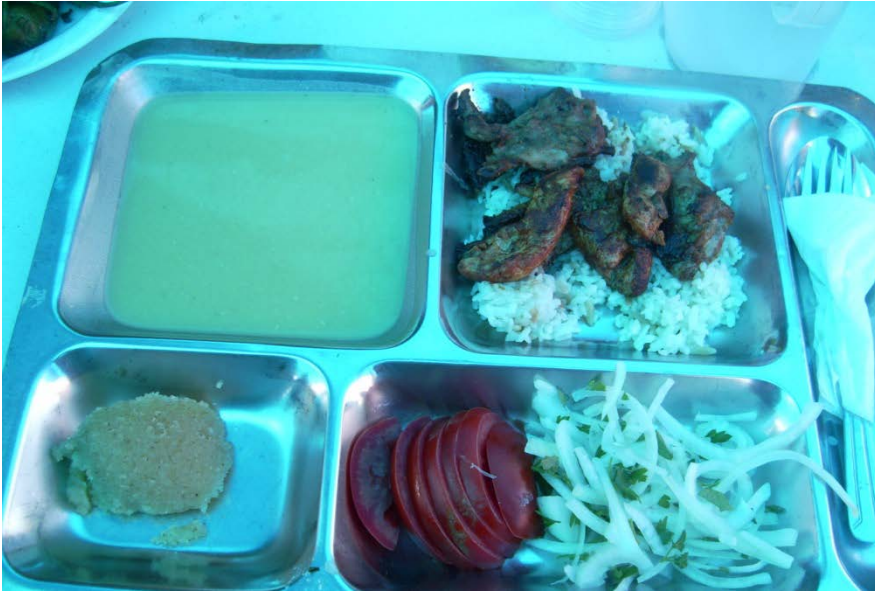
Resim 35: Son yıllarda Denizli yresinde en ok ikram edilen yemek pılav st tavuk ızgara.