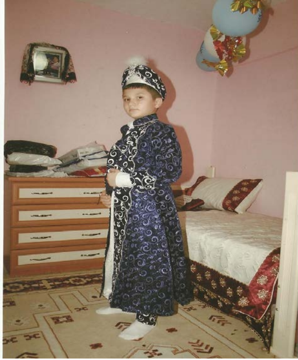
Resim 15: Şehzade kıyafeti şeklinde tasarlanan sünnet kıyafeti

Günümüzde kıyafetlerde de değişiklik olmaya başladı. Bu kaftanlar çıkınca. Eskiden sadece pantolon, gömlek üzerine pelerin ve şapka idi. Bunlar pantolon, gömlek, papyon filan olduğu için batının kıyafetleri idi. Biz geleneksel olsun diye kaftanı tercih ettik. Şimdi Arap elbiseleri gibi fes ve uzun elbise giyenler de var. Başında kahverengi fes, üzerinde beyaz elbise vardı. Tören günü giymişlerdi. Ailenin dinî durumuna göre de değişebilir. Her şeyde olduğu gibi (Adeviye Gencer ile kişisel görüşme, 01 Ekim 2013).