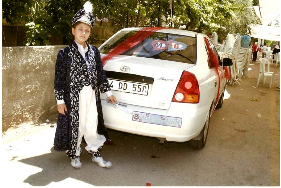
Resim 41: Sünnet töreni için süslenmiş bir araba, arabanın sağ alt kenarında “Ucundan Azıcık” yazmaktadır.

Sünnet törenlerinde çocuğun gezdirilmesi ile ilgili bazı kabuller de zaman içerisinde farkına varmaksızın oluşturulmuştur. Örneğin; Denizli Belediyesinin önündeki meydanda bulunan horoz heykeline kadar konvoy eşliğinde gitmek ve buradan dönmek gibi. Bu davranışın aslına bakıldığında bir amacı yoktur yalnızca herkesin belirlediği bir nokta olma özelliği göstermektedir. Aynı zamanda yine konvoy eşliğinde çocuğu Pamukkale’ye götürmek de sünnet törenlerinin şanıdır. İl merkezinde bu kabuller söz konusu iken ilçe ve beldelerde durum farklıdır. İlçelerde genellikle şehir merkezine doğru bir tur atılıp dönüldüğü, köylerde ise köy meydanında ve köyün çevresinde bir konvoy turu yapıldığı görülür.