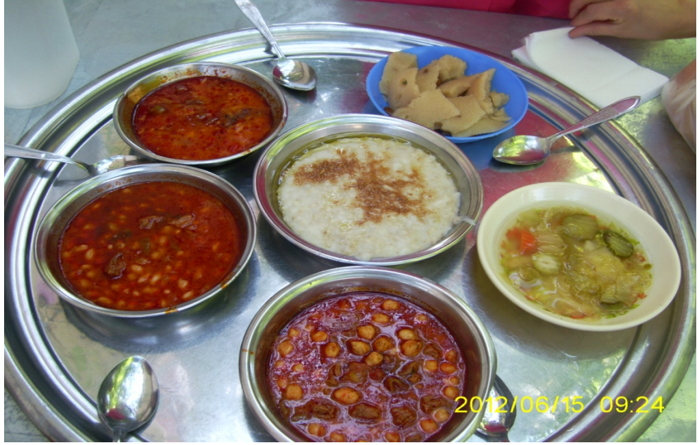
Resim 32: 2012 yılında Denizli Çal/Süller Kasabasında katıldığımız bir sünnet töreninde ikram edilen yemekler

Denizli yöresinde beldeye beldeye ikram edilen yemekler değişse de bazı yemekler düğün ve törenlerin olmazsa olmazı haline gelmiştir. Öyle ki sünnet töreni yaklaşmış bir çocuğa ya da düğün töreni yaklaşmış bir gence: “Senin keşkeği ne zaman yiyeceğiz?” gibi ifadelerle şaka yapılır. Yine düğün bitiminde ise “Bu düğünün de keşkeği yendi” gibi sözlerin sıkça kullanıldığı görülür.