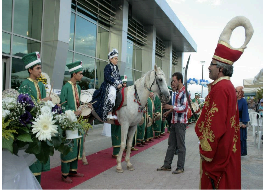
Resim 28: Denizli’de bir düğün salonunda mehter eşliğinde yapılan bir sünnet töreni

Görüldüğü üzere mehteran, sünnet törenlerinde sıkça uygulanan bir gösteridir. Son yıllarda mehteranlı gerçekleştirilen sünnet törenlerinin artmasında yukarıda belirttiğimiz gibi milli ve manevi duyguların etkisi olsa da bunu bir güç ve zenginlik göstergesi sayıp sünnet töreninin şaşalı geçmesi dolayısıyla isteyen aileler etkili olmuştur. Aileler için sünnet töreninin gösterişli ve şatafatlı geçmesi aile için şüphesiz gurur ve övünç kaynağıdır. Mehteran takımı ise bu gurur ve övünç duygularını bir kat daha pekiştirir. Zaten sünnet törenlerinin yapılmasının altında yatan bir gerekçe de bu gurur ve övünç duygularıdır.