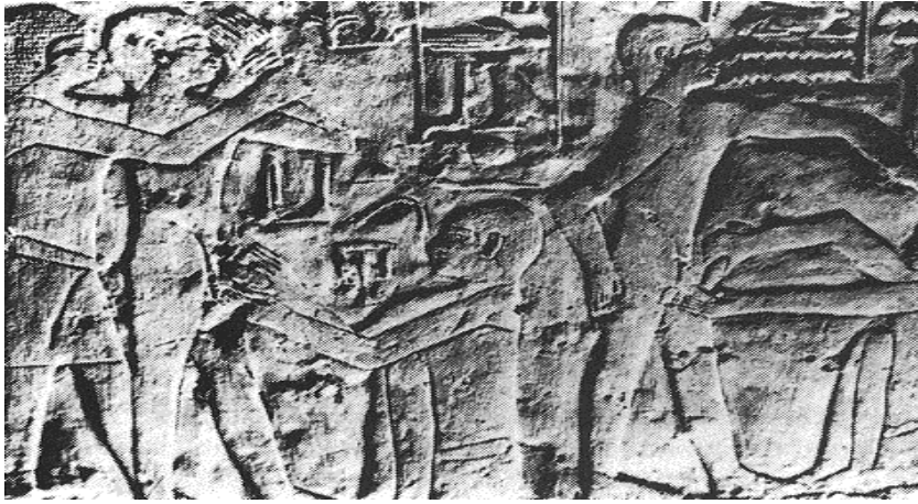
Resim 1: Eski Mısır'da sünnetin tasvir edildiği sünnet sahnesi (Sakkara, Ankhmahor tapınağı)

Sünnetin ilk defa ne zaman yapıldığı kesin olarak bilinmemekle birlikte, araştırmalar sünnetin Eski Mısır, İbraniler ve Fenikelilerde, Amerika kıtasında Azteklerde ve M.Ö. 5000 yılında Babiller ve Zenciler tarafından yapıldığını gösteriyor. M.Ö. 1400 yılında Firavun II. Ramses'in oğlunun sünnet edildiğine dair belgeler bulunmuştur (Ataseven 2005: 11).