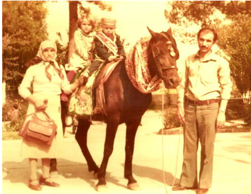
Resim 39: Günümüzden yaklaşık 30 yıl önce bir sünnet töreni