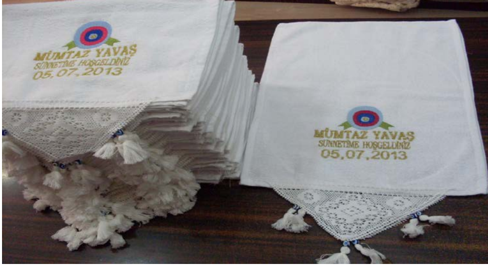
Resim 19: Buldan'da dokunmuş ve dağıtılmış bir sünnet davetiyesi ( http://www.buldangokcetekstil.com/default.asp?git=8&type=product&id=304&place=0 )

Gözlemlerimize ve arařtırmalarımıza göre Denizli yöresinde genel olarak en çok dağıtılan okuntu havludur. Havlunun maliyetinin ucuz olması ve herkese verilebilecek bir okuntu türü olduđu için okuntu olarak en çok satın alınan da havludur.