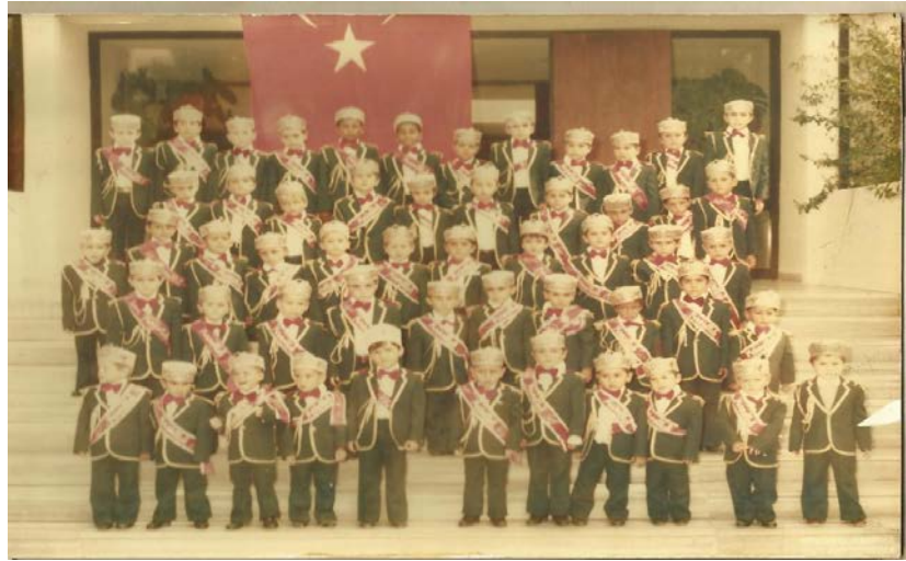
Resim 6: Denizli Basma Sanayi’de yapılan toplu sünnet şöleninden bir görüntü

Denizli Basma Sanayi’de bir sünnet töreni düzenlediler. Biz de orada çalışıyorduk. Orada çalışanların çocuklarını sünnet ettiriyorlardı. Üç dört yılda bir bu şölen geleneksel olarak tekrarlanıyordu. Çocuğu sünnet olacaklar isimlerini yazdırsın, dediler. Biz de isimleri yazdırdık. Bütün masrafları, giysileri fabrika tarafından temin edildi. Takı olarak patron ve patronların hanımları yani şirket olarak her çocuğa birer tane altın taktılar. Elli iki çocuk vardı. Bütün masraflar; giysileri, yemekler fabrika tarafından karşılandı. O zamanın belediye başkanı, valisi de bu törene katılmıştı. Doktorlar geldi. Bir oda hazırlamışlardı. O odada bütün çocukları sırayla sünnet ettiler. Her çocuğun velisi başında bulundu. Orada fabrikanın bahçesinde toplu sünnet edildi. Yemek sırasında mevlit okundu dua yaptılar. Sonra fabrikadaki işçiler bir orkestra kurdular yemekten sonra sazlı,sözlü bir eğlence yapıldı. Atlar geldi. İki tane at vardı. Çocuklar sırayla bahçede ata bindiler (2013).