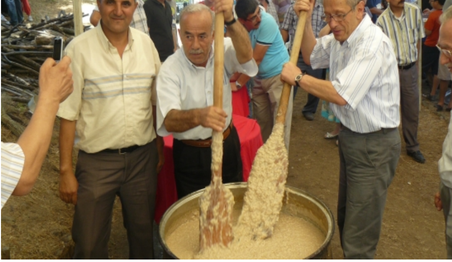
Resim 33: Keşkek törene gelen erkeklerce sırayla karıştırılır.