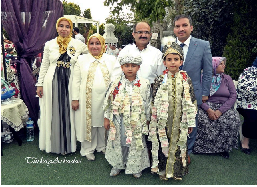
Resim 4: Akraba çocuklarının bir arada sünnet edildiği bir tören

Bundan yirmi otuz yıl öncesinde ise sünnet törenleri yalnızca maddi durumu iyi olan ailelerce yapıldığı için komşu ve akraba çocuklarının bir arada sünnet edildiği de olmuştur. Oğullarına sünnet töreni yapan aileler oğullarının yanında bir fakir ya da öksüz çocuğu sünnet ettirmeyi hem sevap hem de görev bilmişlerdir.