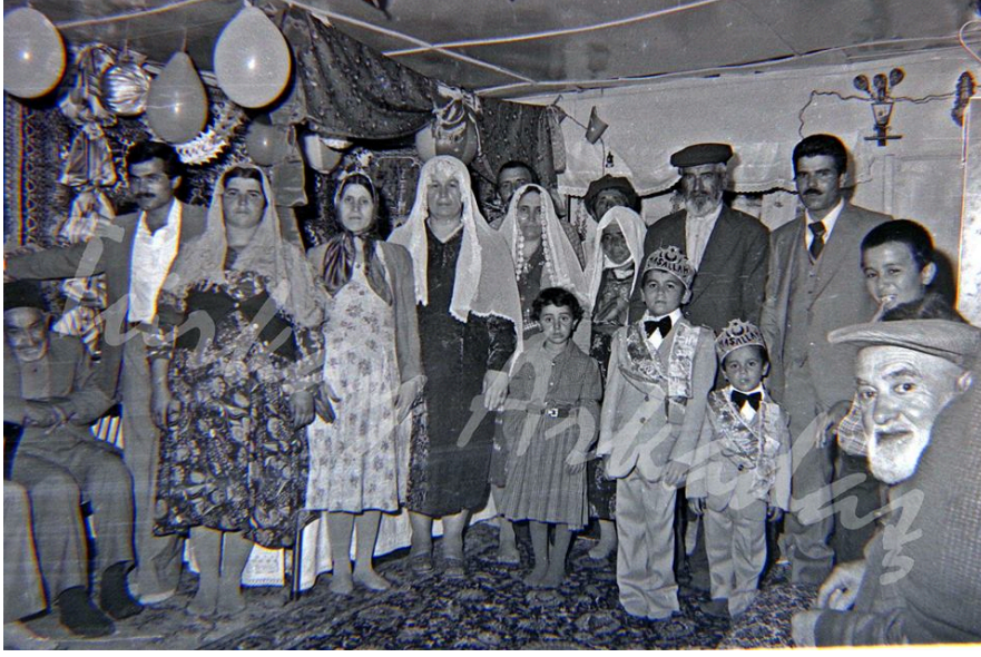
Resim 12: Eski sunnet törenlerinde hazırlanan bir sunnet odası