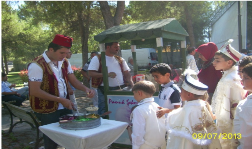
Resim 9: Toplu sunnet şöleninden çeşitli görüntüler