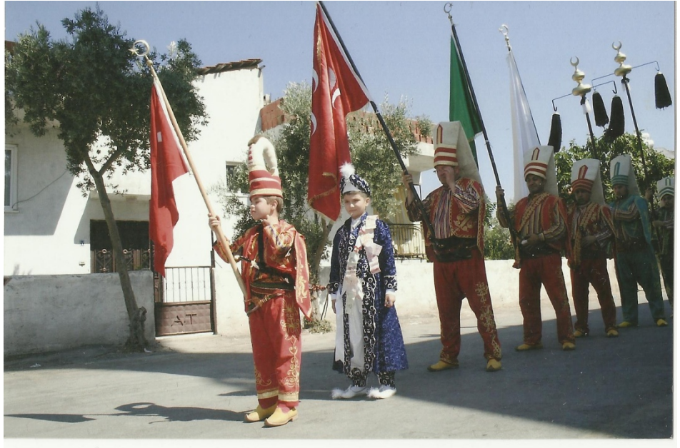
Resim 27: Sünnet çocuğunun mehter takımı eşliğinde yürümesi

(Mehterli bir sünnet töreni nasıl başlar?) Genelde biz evde yapacaksak evin üç yüz beş yüz metre ötesinde duruyoruz. Sünnet çocuğunu da davet ediyoruz. Aileyi de davet ediyoruz. Oradan yürüyerek çocuğu eve kadar getiriyoruz veya mahallede sokaklarda dolaşıyoruz hep birlikte. (Mahallede yürümeniz bir davet midir?) Bu hem bir davettir, hem bir ildir hem de bu güzelliği herkesle paylaşmaktır. Orada mehterle birlikte çocuğun yürümesinde de hem bir güzellik hem de bir hatıra yatar. Bu bir hatıradır. O çocuk büyüdüğü zaman ona bir hatıra. Sonra nevbet yapacağımız yere kadar geliyoruz. Orada düzenimizi alıyoruz. Ondan sonra nevbetin başlangıcında bir selamlama vardır. Önce bir selamlama yapıyoruz. Ondan sonra peşrevle nevbete giriş yaparız. Şimdi peşrevi bitiriyoruz (16 Eylül 2013).