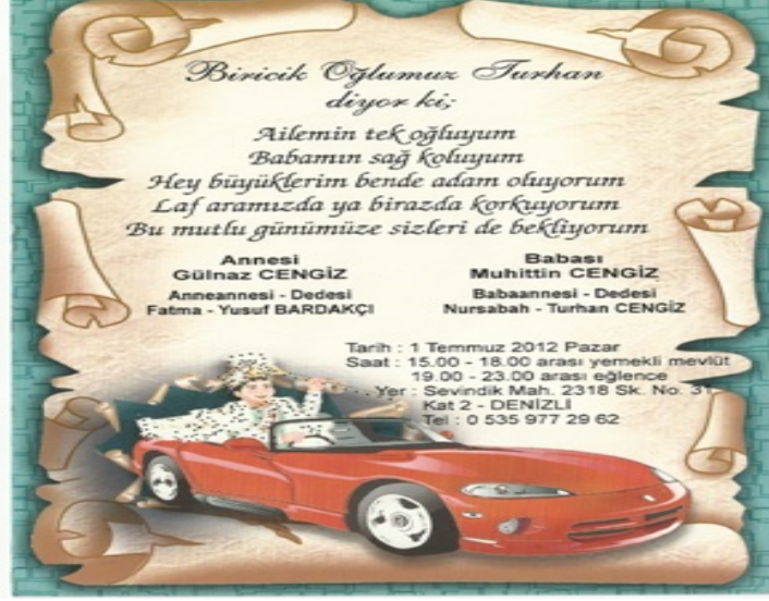
Resim 20: Sunnet çocuğunun özellikleri davetiye sözlerinin belirlenmesinde etkilidir.

Sünnet davetiyesi sözlerinin seçilmesinde ailenin siyasi görüşü ve dünya görüşü de etkili olabilmektedir. Örneğin milliyetçilik duyguları coşkun gelen bir ailenin vatan, millet, bayrak ile ilgili kavramları sünnet davetiyesi sözlerinde kullanması beklenirken dinî duyguları baskın olan muhafazakar bir ailenin davetiyesinde Allah, Hz. Muhammed, ümmet gibi kavramları kullanması olağandır: