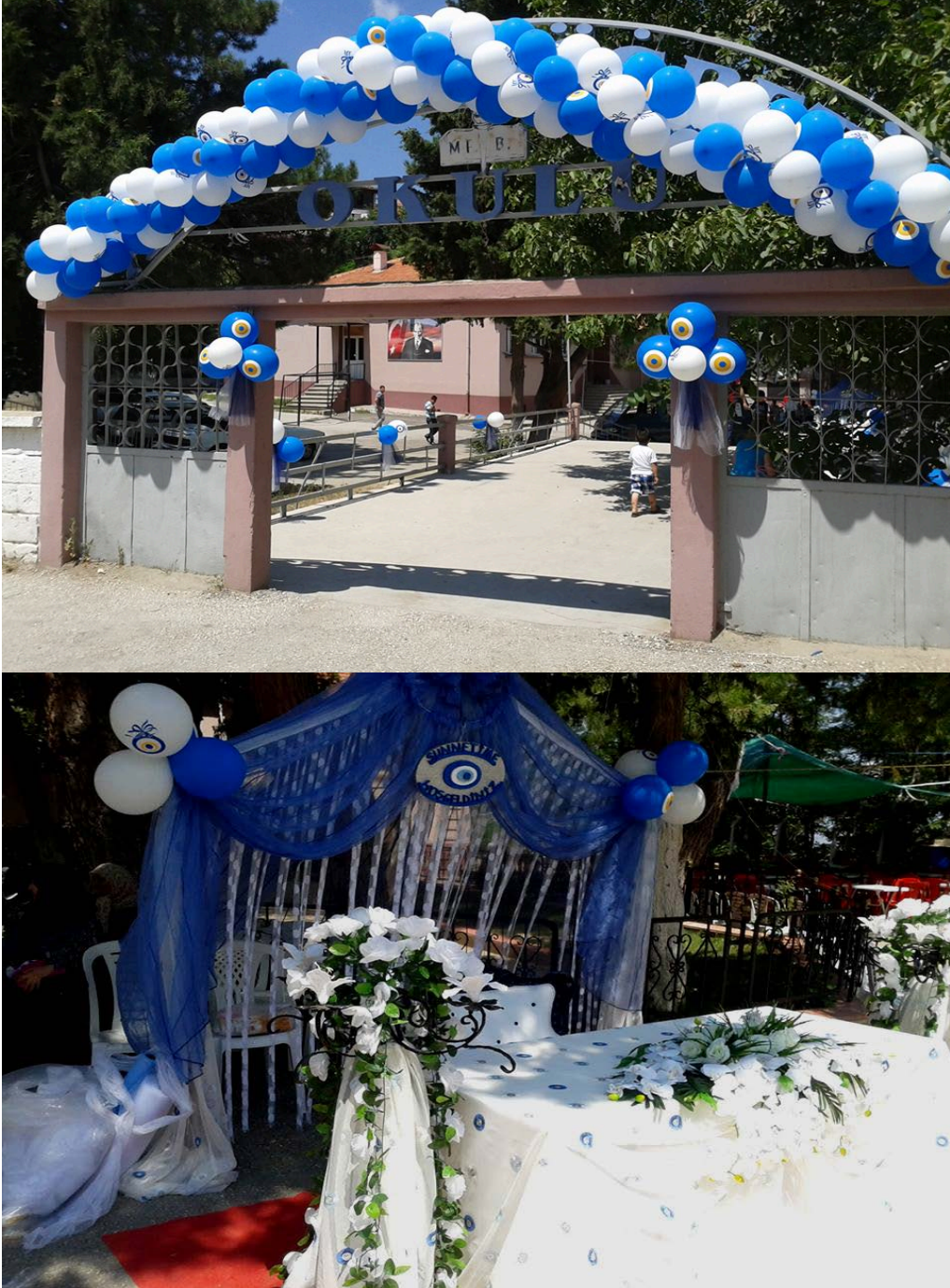
Resim 18: Denizli Babadağ ilçesinde Okul Bahçesinde Bir Sünnet Düğünü

Sünnet törenleri için kiralanan mekânlar: Düğün salonları, restoranlar, çay bahçeleri, küçük eğlence mekânları, okul bahçeleri gibi mekânlardır. Son yıllarda okul bahçelerinde yapılan törenlerin de sıklığı artmıştır.