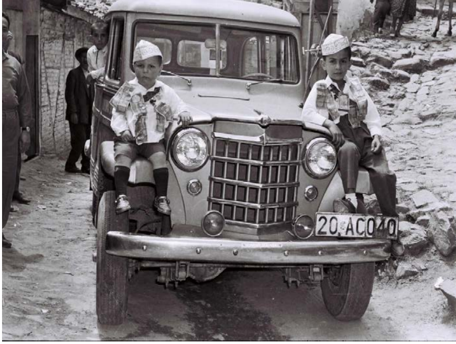
Resim 40: Denizli Babadağ ilçesinde yapılan eski bir sünnet töreni

https://www.facebook.com/photo.php?fbid=10151689992966166&set=g.189970527828706&type=1&theate r)