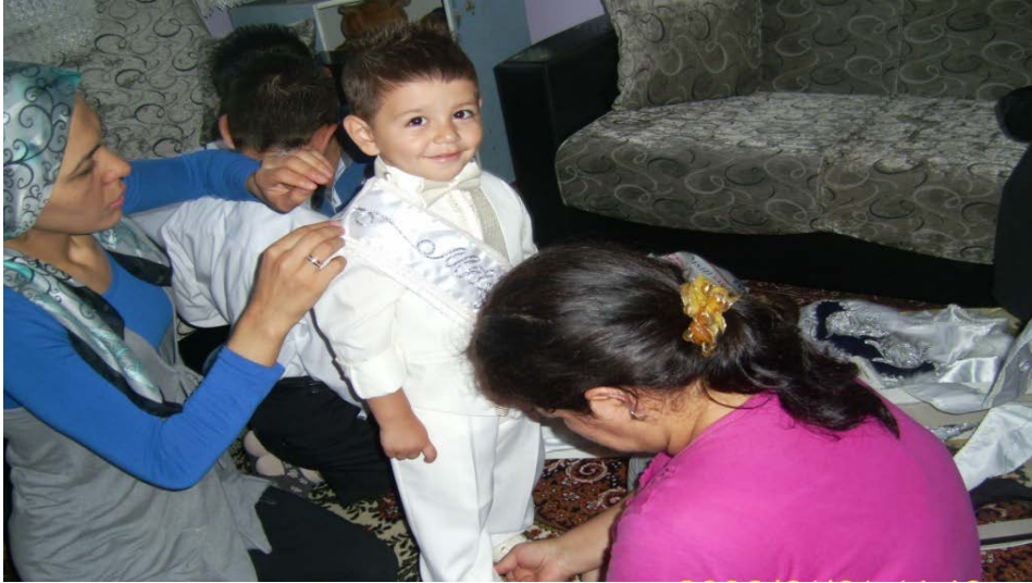
Resim 25: Sünnet çocuğu giydirilirken

Dışarıda yemekle ilgili hazırlıklar devam ederken bir yandan da sünnet çocuğunun törene hazır edilmesi gerekmektedir. Sünnet çocuğu sabah erkenden kalkıp yıkanır, sünnet elbiseleri yakın bir akraba kadın veya anne tarafından giydirilir. Sünnet çocuğunun nazar olmaması için bazen kıyafetinin bir kenarında küçük bir nazar boncuğu iliştilir. Bu aşamadan sonra sünnet çocuğu evin önünde kendisi için hazırlanmış özel masaya oturtulur.