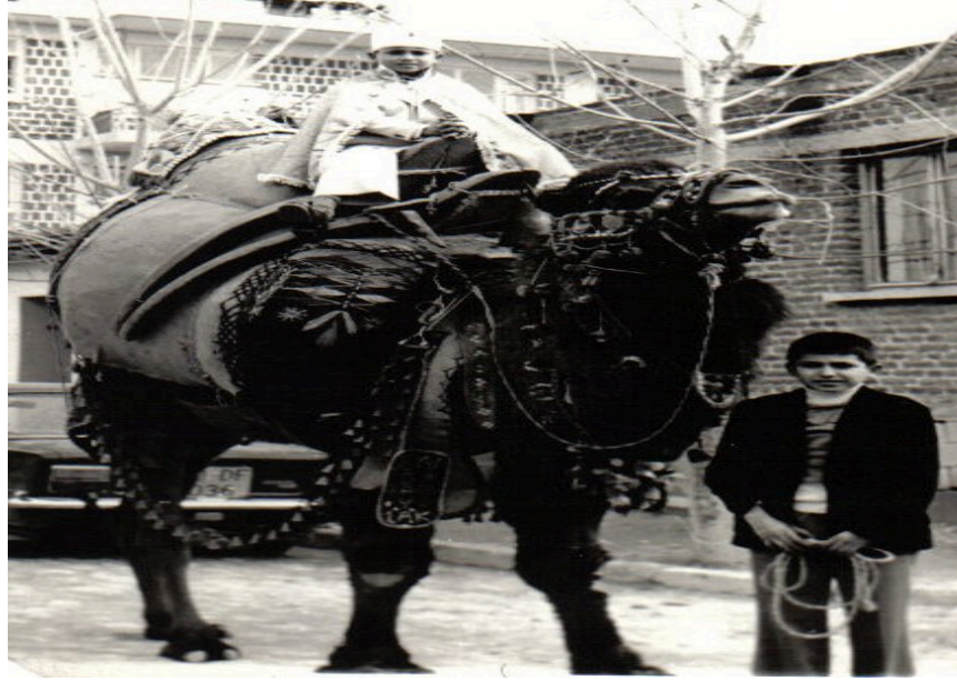
Resim 38: Deve üzerinde bir sünnet çocuğu yaklaşık elli yıl önce ( https://www.facebook.com/groups/189970527828706/photos/?filter=photos )