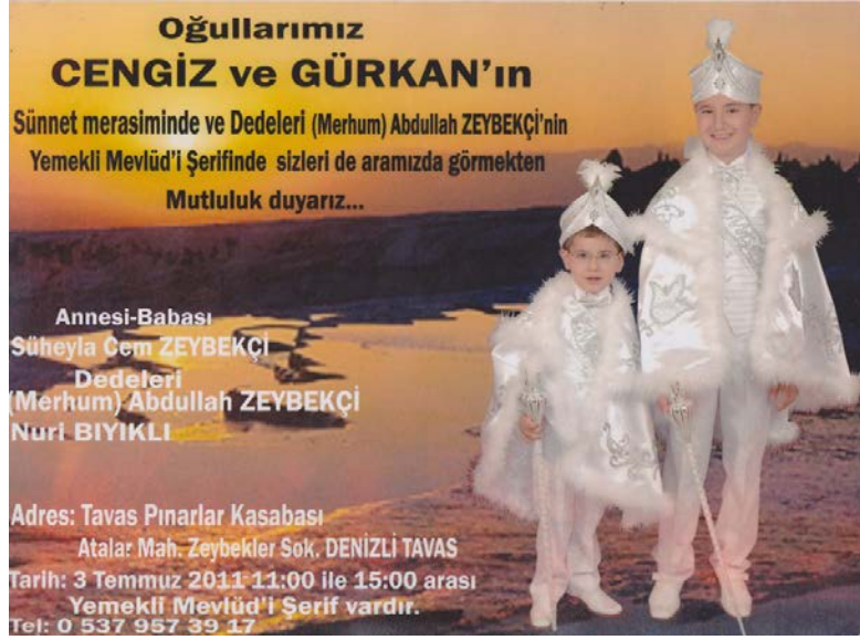
Resim 3: Dedelerinin mevlidi ve çocukların töreni bir arada yapıldığı davetiyede belirtilmiş.

Bağımsız sünnet törenleri düzenlendiği gibi genellikle ağabeyin düğününde veya dede hacca gidip geldiyse dedenin hacı mevlidinde sünnet yapılır (Kutludağ 2004: 145).