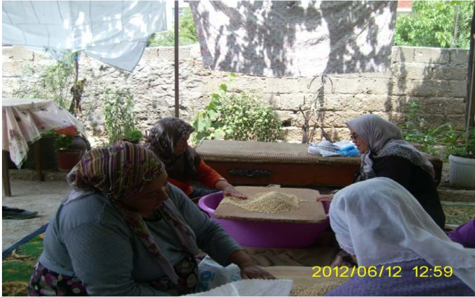
Resim 16: Denizli Çal ilçesi Süller Kasabası törenden birkaç gün öncesi imece usulü keşkeklik buğday ayıklanması

Bu hazırlıkların bazıları günümüzde kısmen de olsa bazı köy ve kasabalarda nadir olarak görülmektedir. 2012 yılında kasabada katıldığımız ve birkaç gün öncesinde de yakından takip ettiğimiz kadarıyla düğün sahibinin kadın komşularının toplanıp keşkeklik buğdayı ayıkladığına şahit olduk. Fakat bu buğday dövülmüş olarak alınmıştır. Yani eskisi gibi keşkeklik buğday dövme gibi bir tören yoktur.