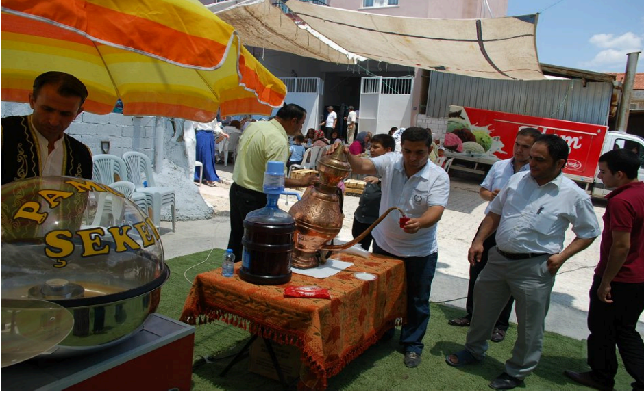
Resim 37: Şerbet ve pamuk şekeri ikramı (www. akishaber.net).