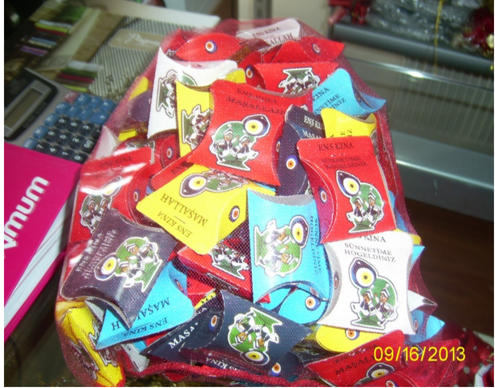
Resim 24: Sünnet kınasında dađıtılan hazır paketlenmiş kınalar

Sünnet çocuđuna kına yakıldıktan sonra tepside kalan kına gelen davetlilere peçetelere konarak dađıtılır. Yine lokumla bisküvi, karışık çerez, meyve suyu gibi ikramlar da kına merasiminden sonra davetlilere ikram edilir.