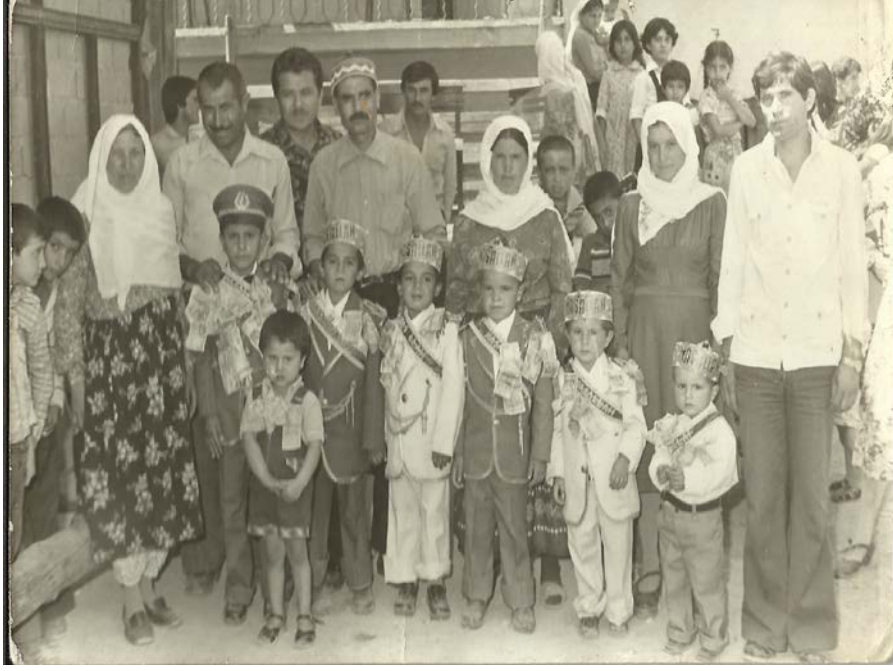
Resim 5: Komşu çocuklarının bir arada sünnet edildiği bir tören yaklaşık 1980'li yıllar

Eskiden sünnet edilecek çocuk tek ise yanında komşudan bir fakir çocuğun da iştirak etmesi hayırlı bir iş sayılırdı ( Darıverenli 1942: 12).