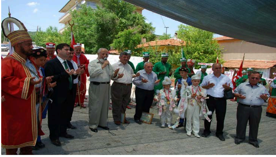
Resim 26: Denizli Kale ilçesinde bir sünnet dua ederken