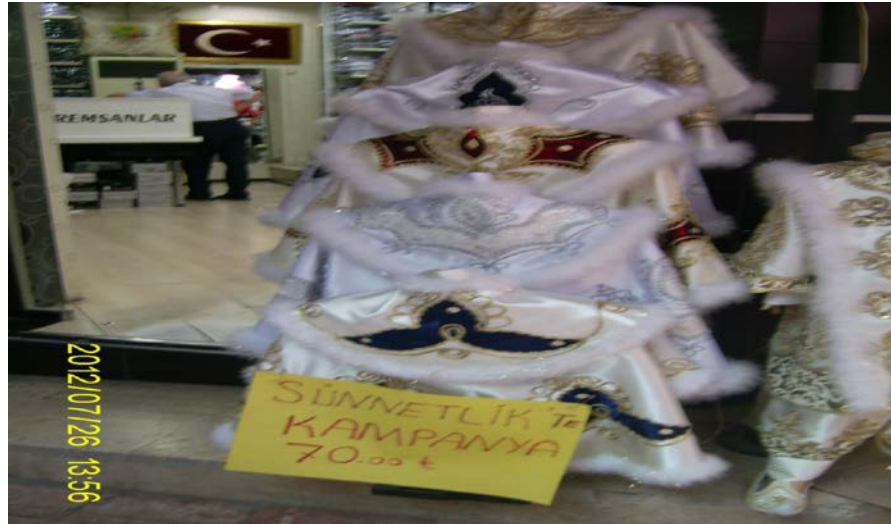
Resim 13: Pelerinli sünnet kıyafetleri