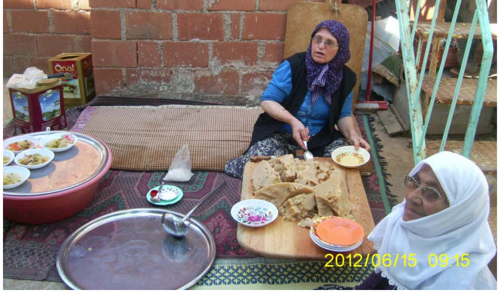
Resim 34: Helva kesme görevi verilmiş bir kadın

Araştırmalarımız ve gözlemlerimiz kadarıyla inanişâ göre aşçıya yardım eden kadınların da belirli özellikleri haiz olması gerekmektedir. Denizli Çal ilçesi Süller Kasabası'nda 2012 yılında katıldığımız bir sünnet töreninde işbölümü yapılırken sünnet çocuğunun annesi komşularından birini helva kesimi ve dağıtımı için belirlemiş fakat diğer bir komşu kadın buna itiraz etmiştir (Fotoğrafta gördüğümüz helva kesen kadın) helvayı herkesin kesemeyeceğini bahtının güzel olan birinin bunu yapması gerektiğini belirtmiştir.