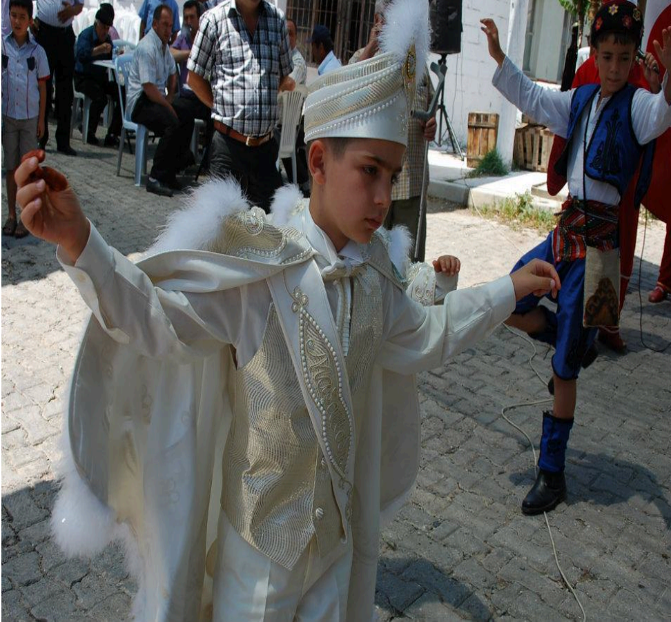
Resim 23: Resimde sünnet çocuğunun sağ elinin silah tutan işaret ve baş parmağına kına yakılmış

Sağ eline serçe parmağına kına yakılır. Silah tutana yaktırmadılar. Kına değdi mi silah tutmazmış el, diye silah tutana yaktırmadılar. Sadece serçe parmağına yaktılar (Şaziye Akman ile kişisel görüşme, 1 Eylül 2013).