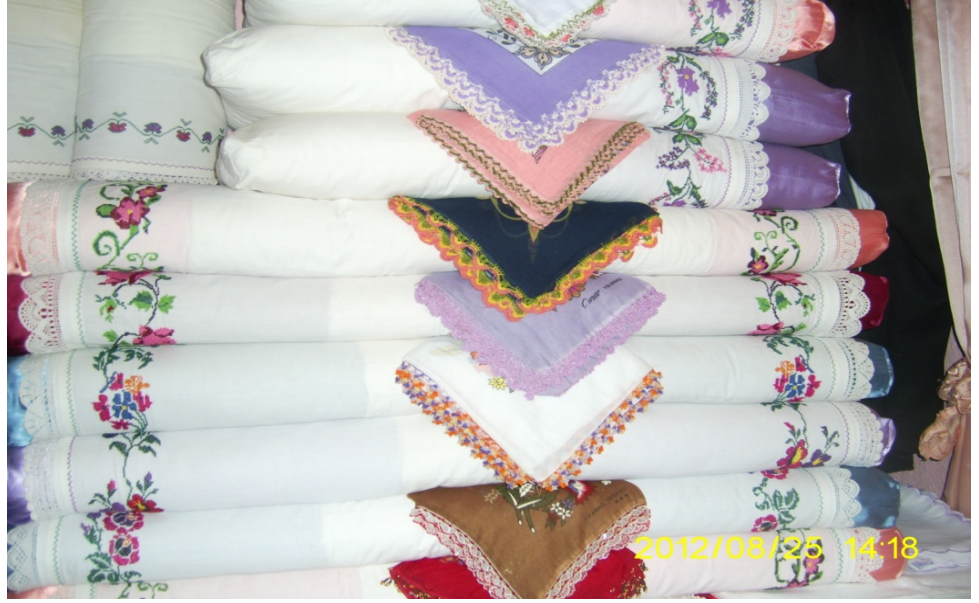
Resim 11: Sünnet odasında yüklük kısmına döşenmiş dantel ve kanaviçeli yastıklar ve aralarında oyalanmış yazmalar

Sünnet törenini evinin bahçesinde yapan bazı aileler sünnet odası süslemek yerine sünnet karyolasını süsleyip evin bahçesine de koyabilmektedir. Ancak bu gelenek Denizli ve çevresinde pek rastlanan bir durum değildir. Nadir de olsa bu duruma rastladığını söyleyen kaynak kişiler olmuştur.