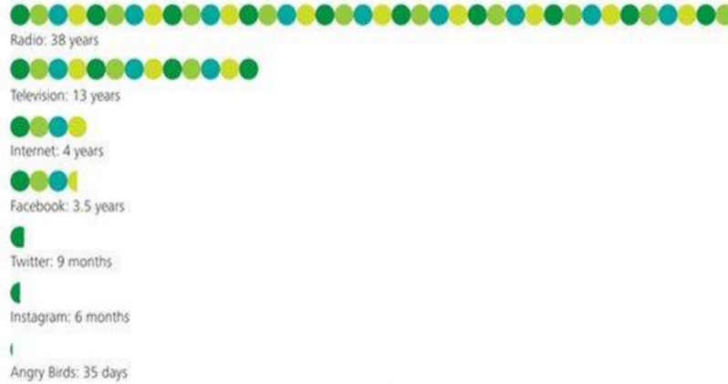
Figure 2. Time to reach 50 million users

Source: Bernd Leger, "20 fresh mobile trends," Localytics, May 13, 2013, http://www.localytics.com/blog/2013/mobile-statistics .