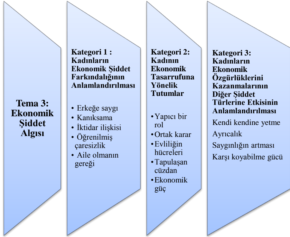
Şekil 4: Tema 3 Ekonomik Şiddet Algısı