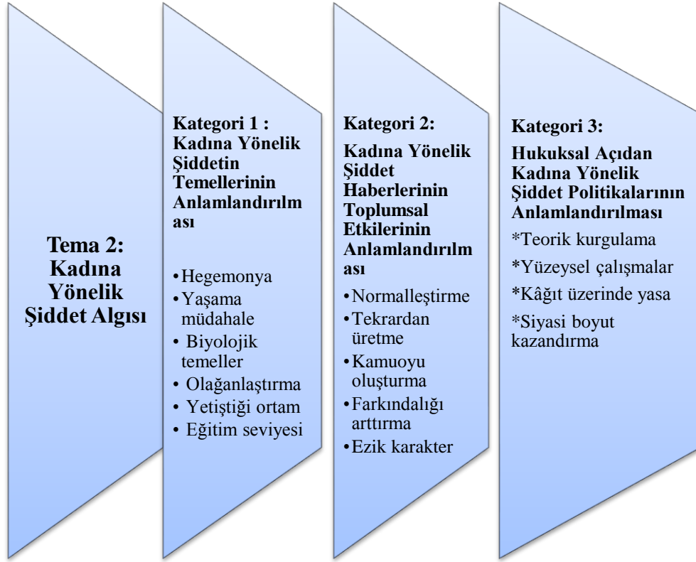
Şekil 3: Tema 2 Kadına Yönelik Şiddet Algısı