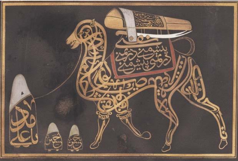
Resim: 4. Söylenceye göre kendi cenazesini taşıyan Hz. Ali'yle birlikte Hz. Hasan ve Hüseyin'e de yer veren, tarihi ve sanatçısı meçhul bir diğer yazı-resim lehası.