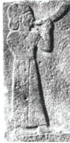
Fig.4. Karkamış Ortostati (Geç Hitit Dönemi) üzerinde boynuz çalan müzisyen betimlemesi (Alp, 1999:32)

Flüt/ Çift Flüt: İnsanoğlunun en eski müzik aleti olarak bilinen flüt, Hitit yazılı belgelerinde “uzun kamış” olarak tanımlanan üflemeli bir müzik aleti olarak Hitit kült metinlerinde sıkça yer almaktadır 31 . M.Ö. II. bin yılda flüt betimlemeleri yerini Hitit törenlerinin işlendiği kült vazolarında yerini çifte flüte bırakmıştır. Betimlemelerde görülen örneklerinde çifte flütün gövdesi birbirinden ayrık veya bitişik olabilmektedir. Çıkardığı