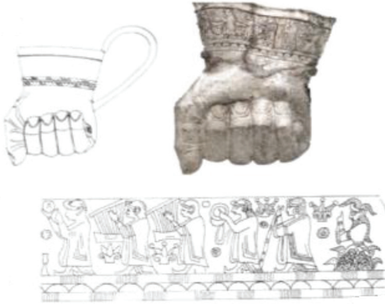
Fig.8. Yumruk biçimli sunu kabı üzerinde kayışla/ iple birbirine bağlı çalpara betimlemesi (Sipahi, 2019: 95, Resim 14).

Çalpara: Kendinden ses veren müzik aleti olan çalparalar, iki yuvarlak tahtadan ya da madenden yapılmış, aynı zamanda birbirine vurulduğunda ses veren vurmalı çalgı olarak da sınıflandırabileceğimiz bir müzik aletidir 38 . Hitit kült törenlerinin tasvir edildiği İnandık, Bitik ve Hüseyincede kült vazolarındaki betimlemelerden tören müzik aleti olduğu anlaşılmaktadır Bazı betimlemelerde göğüs hizasından biraz yukarıda bir iple veya kayışla birbirine bağlı çalparaların 39 (Fig. 8) kadın ve erkek müzisyenler tarafından ayakta icra edildiği görülmektedir 40 .