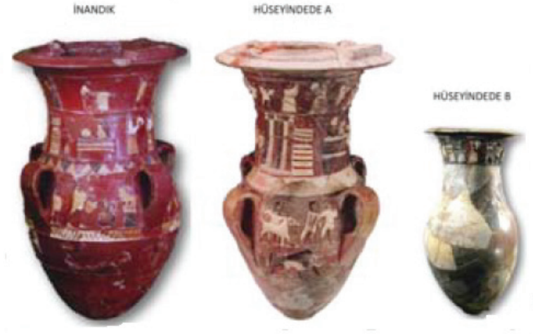
Fig.1 Hitit Dönemi Tasvirli Kült Vazoları (Sipahi, 2019: 94)

zoları da Hititlerin müziğe verdikleri önemi anlamamız açısından destek sağlamaktadır ( Fig.1 ) 15 . Eski Hitit Dönemine tarihlenen Bitik, Eskiyyapar, İnandık ve Hüseyinde de yerleşimlerinde ele geçen tasvirli kült vazoları üzerindeki betimlemeler kült ritüellerinin ve bayram merasimlerinde yer alan müzik ve müzik aletleri hakkında bilgi edindiğimiz önemli buluntular arasında yer almaktadır 16 . Hitit metinlerindeki bazı müzik aletlerinin filolojik karşılıkları konusunda tartışmalar devam etse de Eski Hitit Dönemi kabartmalı kült vazoları bu konuya görsel destek sunmaktadır 17 .