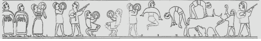
Fig.3 Hüseyindede kült vazosu üzerinde saz, çalpara betimlemeleri (Sipahi, 2005: Fig.1)

Boynuz: Üflemeli müzik aletleri içerisinde sınıflandırılan boynuz, doğal trompet olarak da tanımlanmaktadır. Hitit çivi yazılı metinlerinde kraliyet ailesinin katıldığı kült ritüellerinde, bayram merasimlerinde ve resmi törenlerin başlangıç ve bitişlerini haber vermek amaçlı kullanıldığı belirtilmektedir 29 . Tasvirli eserlerde diğer müzik aletleri ile birlikte çok az tasvir edilmiş çoğunlukla erkek müzisyen figürü ile birlikte tek olarak betimlenmiştir 30 ( Fig.4 ).