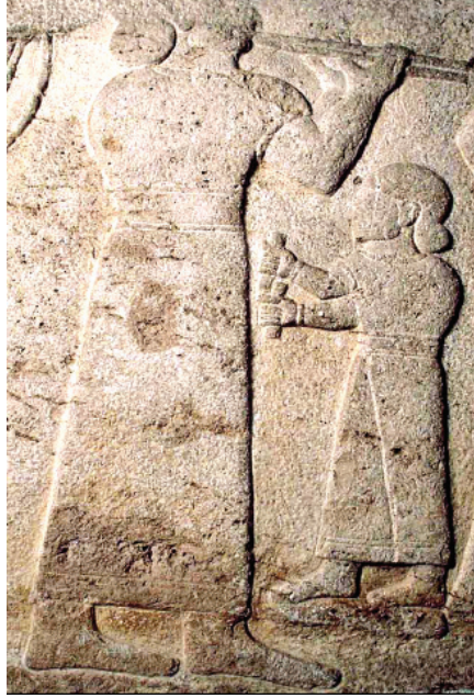
Fig.5. Karkamış Ortostat üzerinde çifte flüt icra eden müzisyen betimlemesi (Alp, 2003: 75, 42b).

kuvvetli ve sert sesiyle insanların üzüntülerini/acılarını dile getirmede, tanrılara haykırmada kullandıkları düşünülmektedir. 32 Hitit yazılı belgelerinde kral veya kraliçenin ölümünde halkın flüt çalarak yas tuttuğu yer almaktadır 33 . Hitit metinlerinden edinilen bilgiye göre müzisyenlerin çift flüt çalmayı bırakıp aynı zamanda icra edilen şarkıya eşlik ettikleri bilinmektedir 34 (Fig. 5).