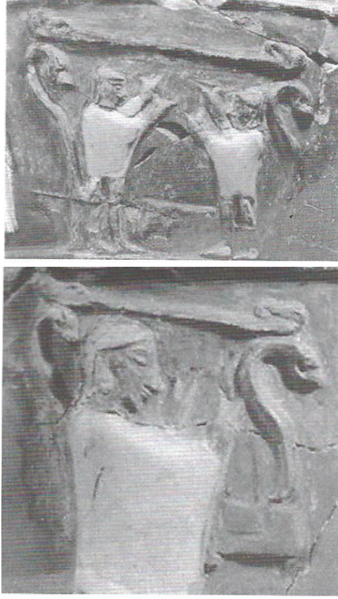
Fig.3. İnandık Kült Vazosu üzerinde büyük lir ve küçük lir betimlemeleri (Ensert, 2013: 44, Res.13).

Bağlama/Saz: Telli müzik aletleri içerisinde değerlendirilen bağlamanın, tasvirli eserler üzerinde betimlenen biçimleri ile günümüz Anadolu'sunda kullanılan formları arasındaki benzerliği oldukça dikkat çekicidir. Bu benzerlikten hareketle B. Dinçol 24 ve A. Ünal 25 çalışmalarında “saz” kelimesini kullanmayı tercih etmişlerdir. Arkeolojik veri olan tasvirli eserler kaynak alınarak bağlama tipi saz tanımlaması kabul görmektedir 26 . İnandıktepe ve Hüseyindede kült vazoları üzerinde yer alan betimlemelerde icrasının erkekler tarafından yapıldığı 27 , müzisyenlerin ayakta ve göğüs hizasında çaldığı görülmektedir. Yuvarlak gövdeli ve uzun sapları ile betimlenen müzik aletinin çalınış tarzları ve tipleri günümüz bağlaması ile yakın benzerliği gözlemlenmektedir ( Fig.3 ) 28 .