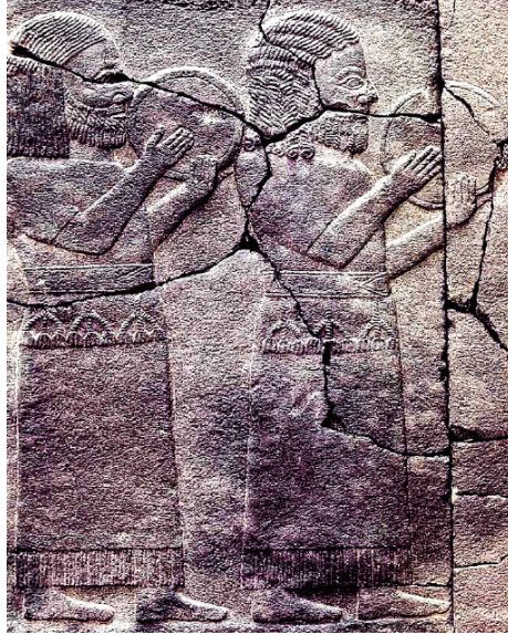
Fig. 7. Zincirli ortostatı üzerinde tef/def çalan müzisyenler betimlemesi (Alp, 1999:35).

Tef/Def: Hititlerde bayram törenlerinin tasvir edildiği kabartmalı vazolar üzerinde karşımıza çıkan bir diğer vurmalı müzik aleti de tef/defdir. Geç Hitit Dönemine tarihlenen kabartmalı eserlerde sıkça tasvir edilen, küçük deri gergili çalgı olarak da tanımlanan bu müzik aleti, kimi zaman icra eden müzisyenlerin omuz hizasında kimi zaman da aşağıda tutulmuş biçimde betimlenmiştir 37 (Fig.7).