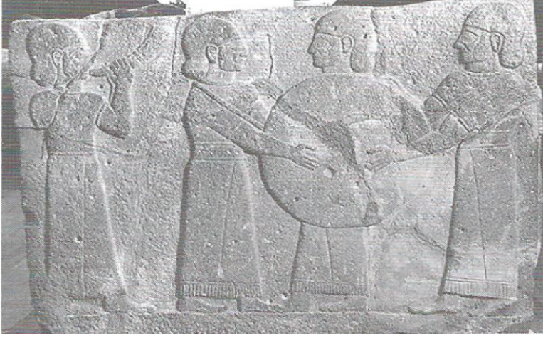
Fig.6. Karkamış Ortostatı (Geç Hitit Dönemi) üzerinde boynuz çalan müzisyen betimlemesi (Akugal, 1995, Lev.99b)

Tef/Def: Hititlerde bayram törenlerinin tasvir edildiği kabartmalı vazolar üzerinde karşımıza çıkan bir diğer vurmalı müzik aleti de tef/defdir. Geç Hitit Dönemine tarihlenen kabartmalı eserlerde sıkça tasvir edilen, küçük deri gergili çalgı olarak da tanımlanan bu müzik aleti, kimi zaman icra eden müzisyenlerin omuz hizasında kimi zaman da aşağıda tutulmuş biçimde betimlenmiştir 37 (Fig.7).