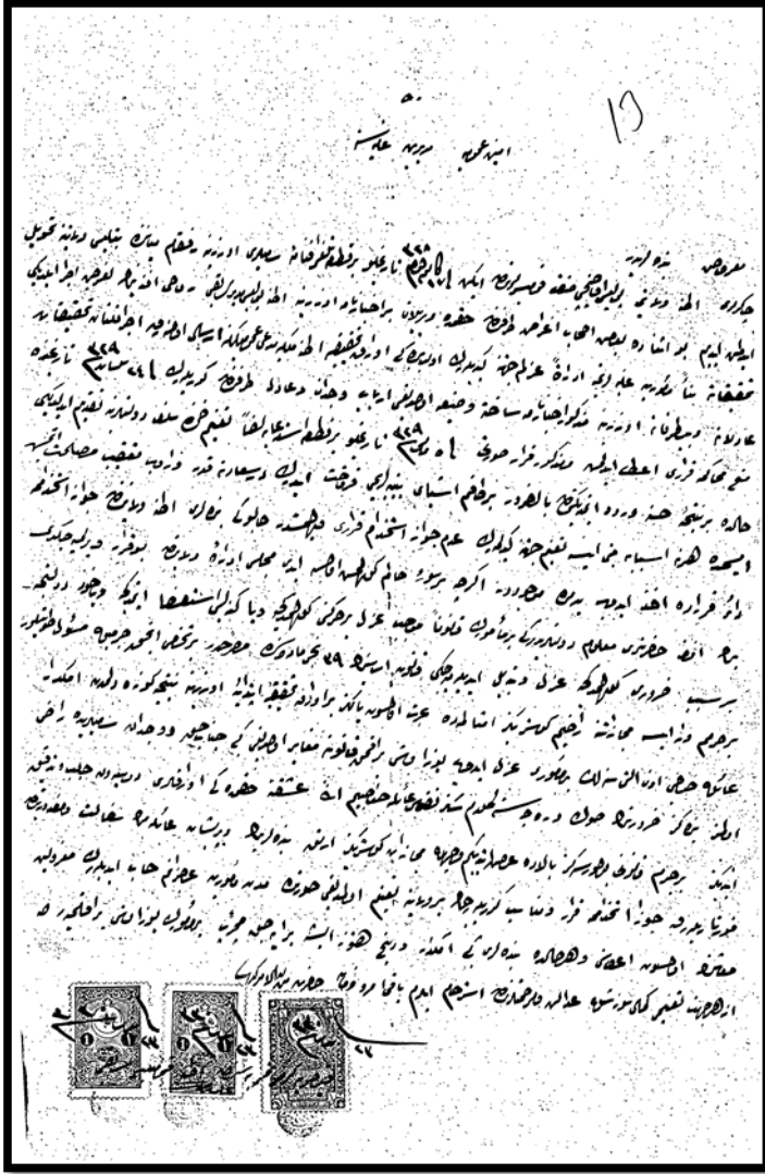
Ek 2- Ali Rıza'nın Emniyet-i Umumiye Müdüriyeti'ne Sunduğu Bir Dilekçe