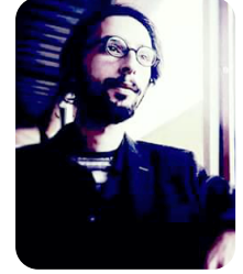
İsmail Doğan Edebiyat Fakültesi/Çağdaş Türk Lehçeleri 3. Sınıf

Sırtlanıyor sırtlanan veda yükünü Bilmem kaçınıcı peron muavini, Üst üste koyuyor hepsini “Sivas yolcusu kalmasin”